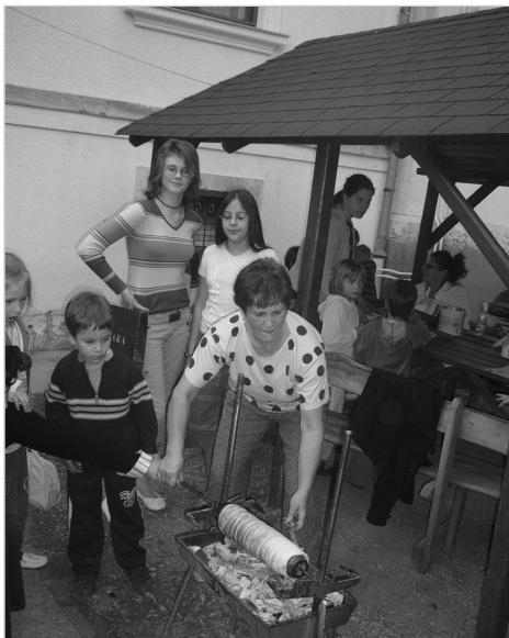
Készül a kiürtős kalács