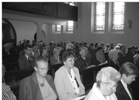
Az ünneplő vasárnapi gyülekezet

A 78 éves évforduló alkalmából szervezett gyülekezeti hétvégére érkeztünk feleségemmel és tízhónapos gyermekünkkel Kelenföldre október havának 15. napján. Az ezt megelőző napon Orosházán voltunk, ahol a magyar anyanyelvű evangélikusok első világtalálkozójának zászlóbontási rendezvényén vettünk részt. A nagyszabású oros-