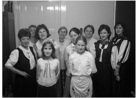
A búcsúest háziasszonyai és leányai

De fontosak ezek minden kelenföldi háziasszony számára! Fontos, hogy együtt készüljünk az ünnepekre, hogy mindenkinek legyen feladata, hogy mindenki az otthonából „odacsempészhes-