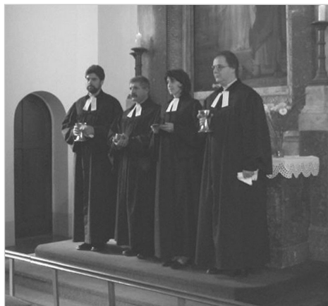
„Jöjjetek, íme minden kész!”

házi rendezvénysorozat sokszínű programja számomra azt üzent: a magyar evangélikus világszervezet, a Maec előtt, a jövőben széles távlatok nyílhatnak a magyar-magyar evangélikus kapcsolatok fejlesztésében és erősítésében.