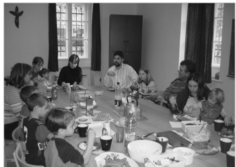
Fiatal családok találkozója