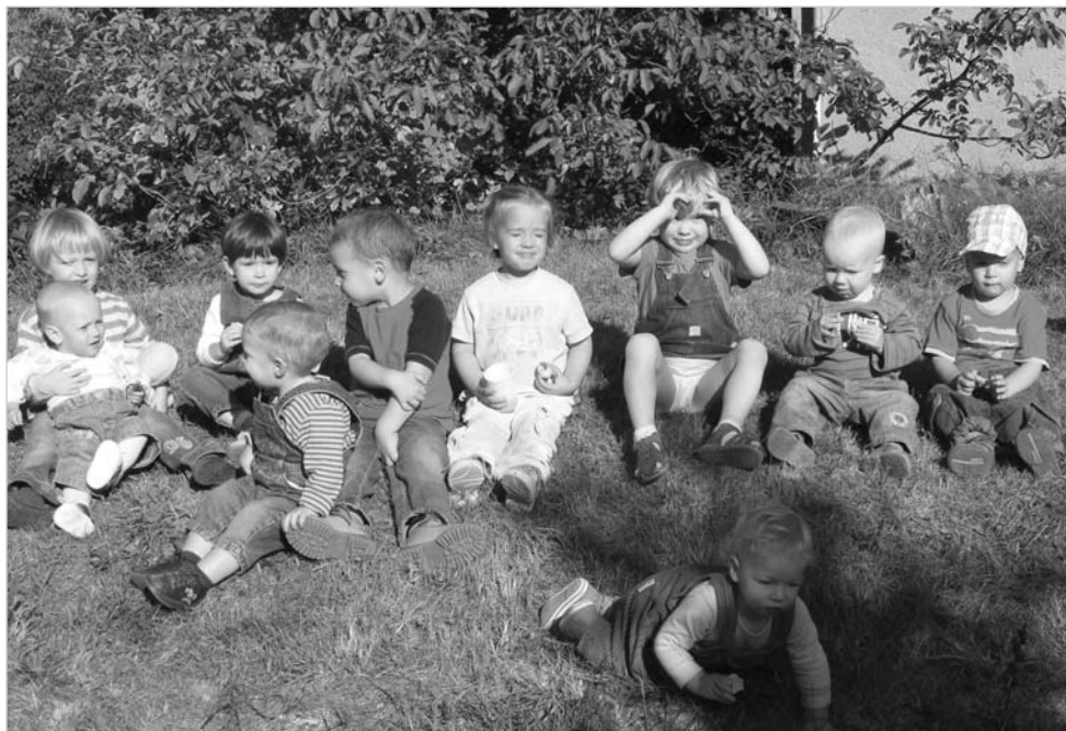
Fiatal családok kirándulása Tökön – a kicsik