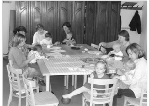
Játszóház az alsagsori teremben