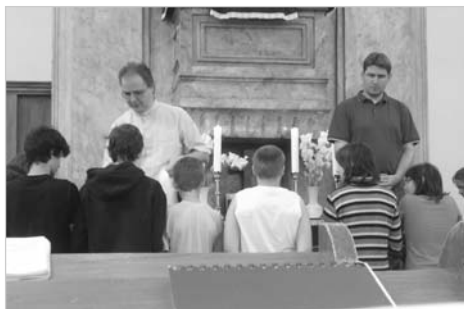
Úrvacsoraosztás a záró alkalmon