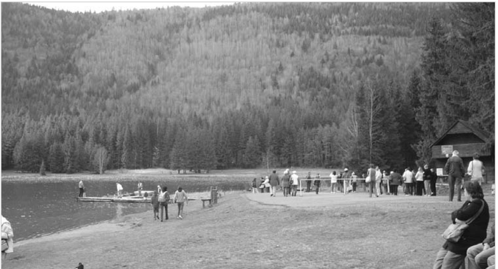
A Szent Anna tónál