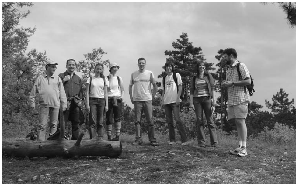
Felnőtt ifjúsági kirándulás a budai hegyekben