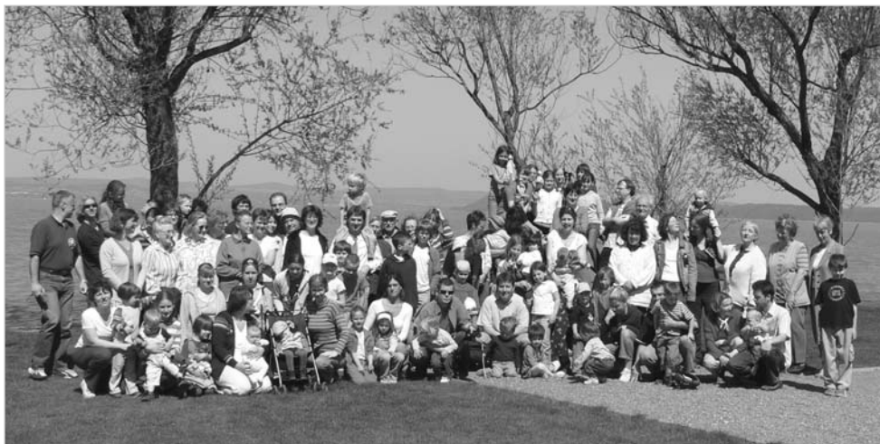
Tavaszi gyülekezeti hétvége Balatonszárszón