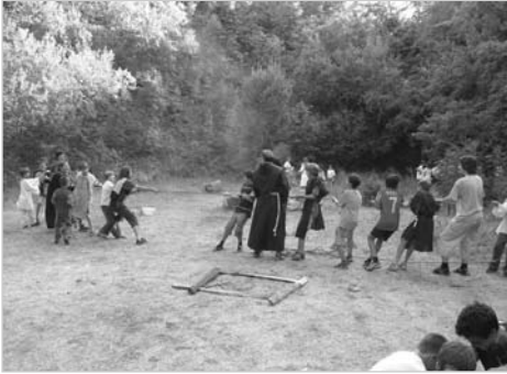
Felekezetek közötti hitvita