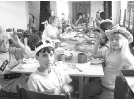
Együtt a terített asztalnál