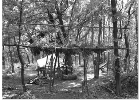
A Farkas körlet kapuja