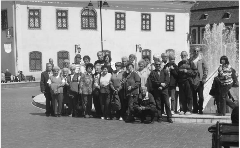
Csoportkép Brassó főterén