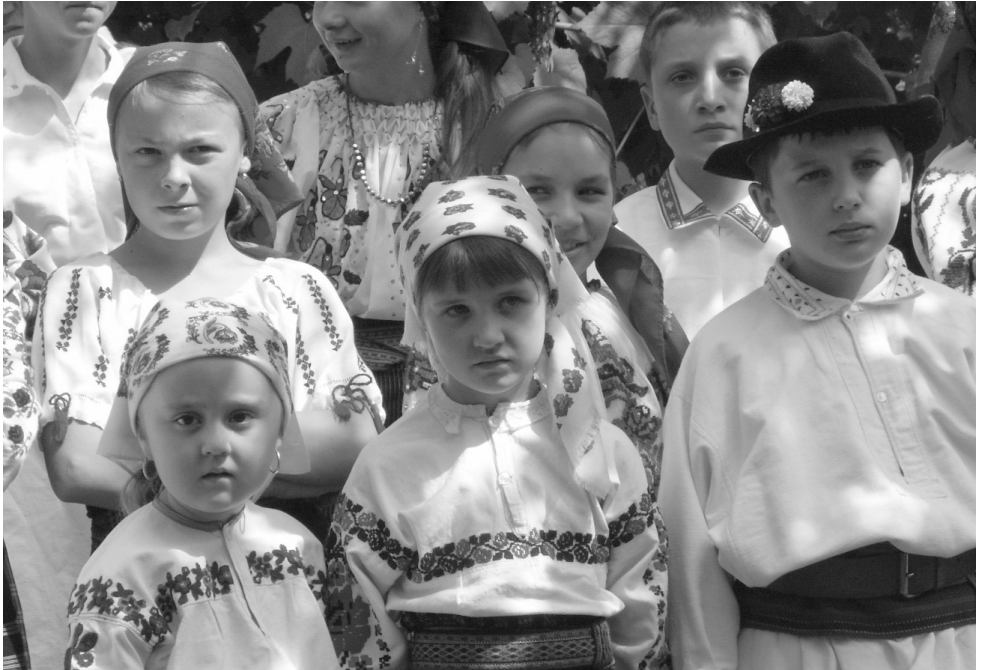
A jövő nemzedéke