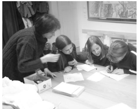
„Kódexmásolók” – Gyülekezeti hétvége, október 19–21.