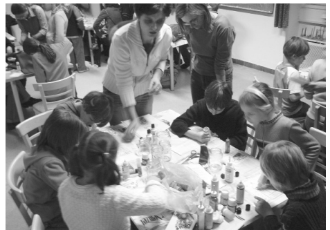
Üvegfestés – Adventi délután, december 1.