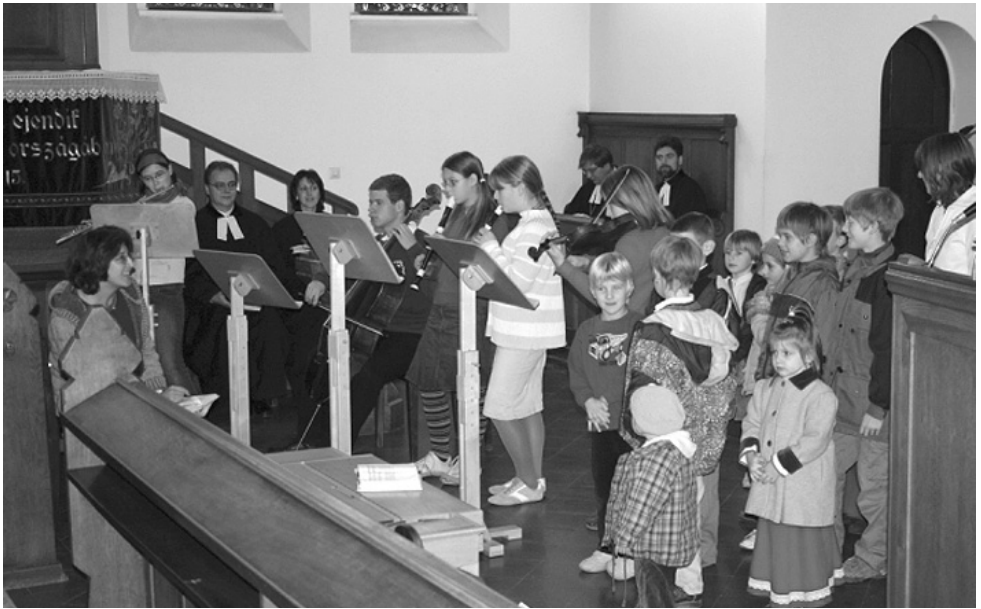
Az ünnepi istentiszteleten

kuszgolyókat, amelyekbe egy-egy ígét rejtettek el. Idén a nagyifjúság tagjai ráadásul még meseolvasással is tarkították a délutánt. Kisfiam máig emlékszük a mesékre, amelyeket a fiatalok olvastak. Köszönet érte!