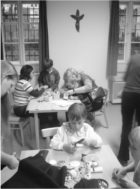
Készülnek az ajándékok – Adventi délután, december 1.