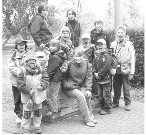
A jövő nemzedék egy csoportja – Gyülekezeti kirándulás, Ópusztaszer, október 13.