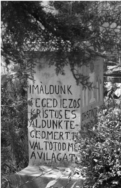
Útszéli kereszt régi magyar felirata (Forrófalva)

vában, több mint 90%-uk magyar eredetű. Mintegy 80-90 faluban 60-70 000 fő beszéli a magyar nyelvet. Fontos megjegyezni, hogy a moldvai magyarság az egyetlen Kárpát-medencén kívüli őslakos magyar népcsoport.