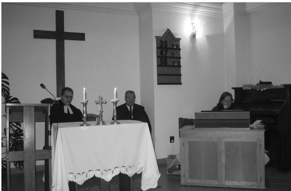
Szenteste Farkasréten: közös istentisztelet a reformátusokkal