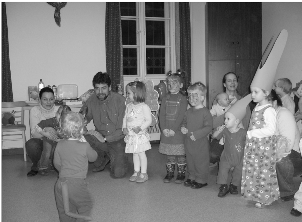
A legkisebbek farsangja