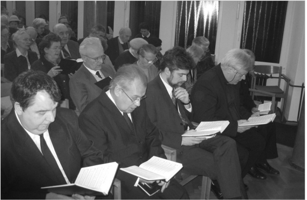
Ökumenikus imaheti alkalom a baptistáknál