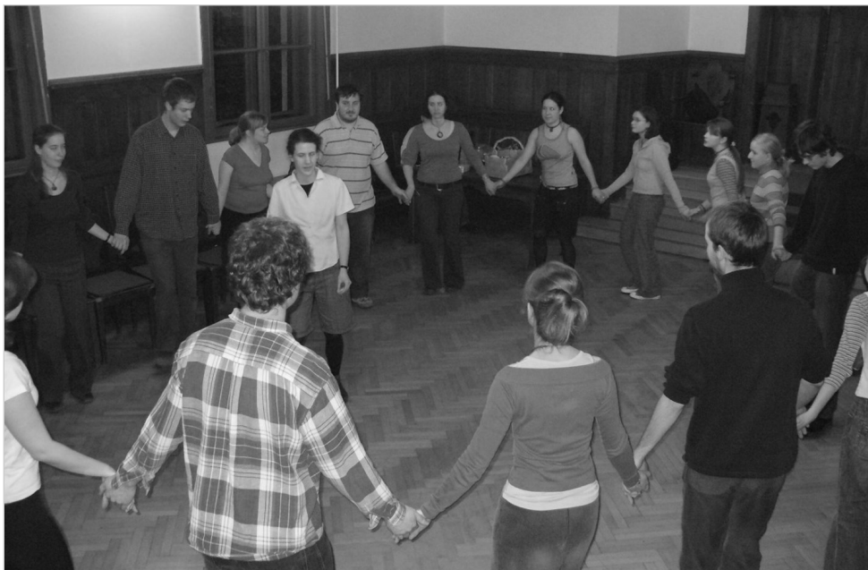
Tánc tanulás az ifjúsági farsangon