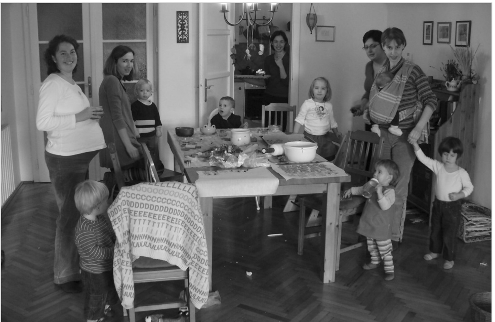
Sütés a játszóházban