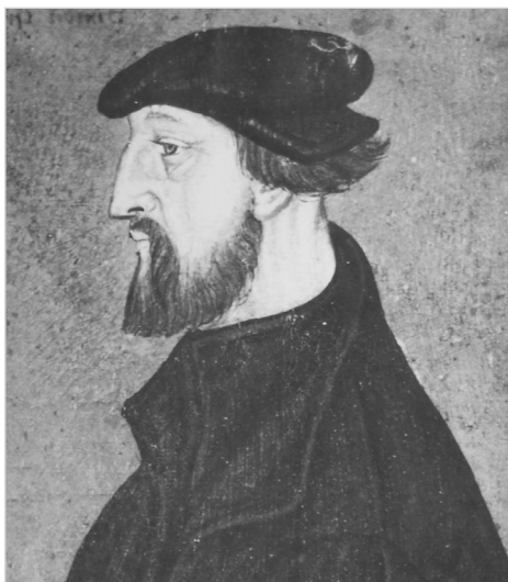
Simon Grynaeus (gouache, papíron, 1530/1550)

– Csak hogy megpróbáljunk elképzelni egy ilyen folyamatot, kérlek, vázold, hogy hány helyen zajlott a kutatásod? Milyen könyvtárakat, internetes lelőhe-