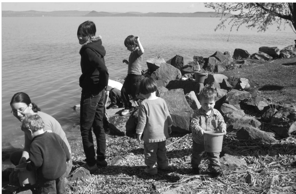
Dolgoznak a fiatal gyerekvigyzók a Balaton partján