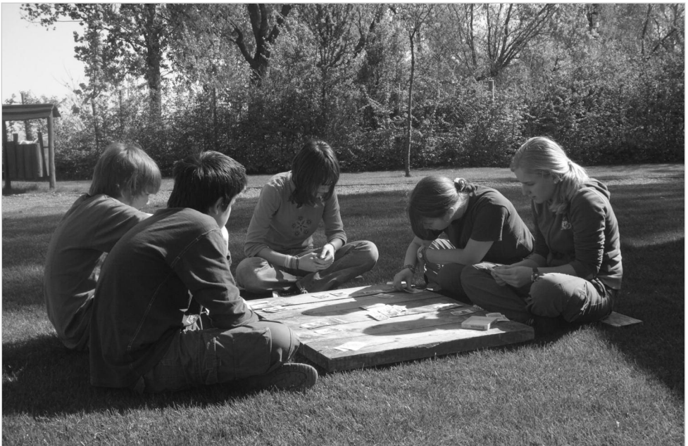
A kisfisek félrevonultak a gyülekezeti hétvégén