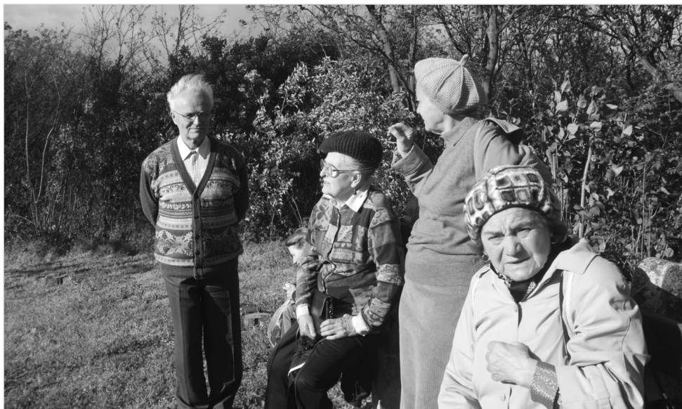
Gyülekezeti hétvége Szárszón – A boglári dombokon