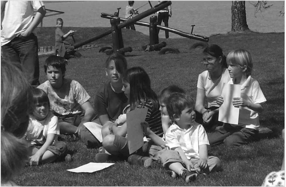
Eredményhirdetés a szárszói akadályverseny végén