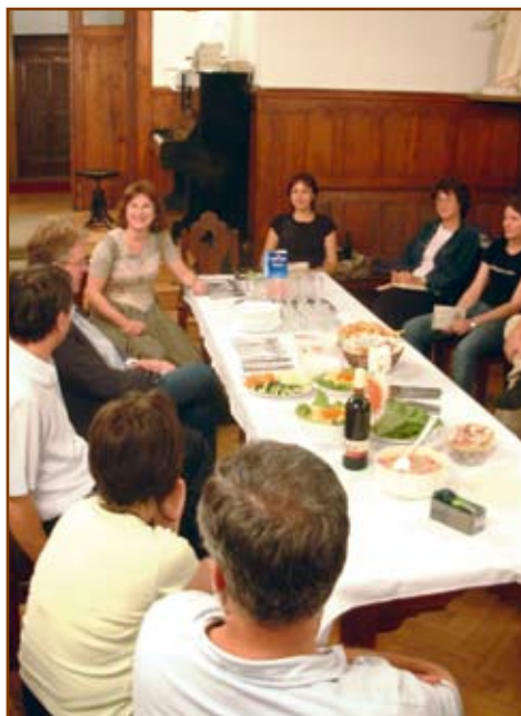
A középker szeptemberi nyitó alkalma