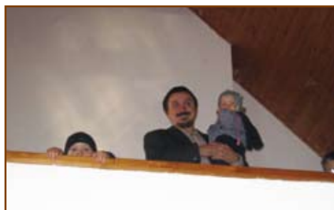
A farkasréti karzaton