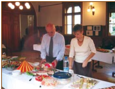
Asztalterítés a vasárnapi közös ebédhez