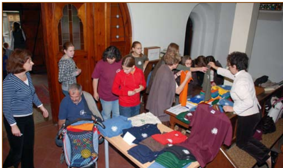
Kezdődik a pólóvásár