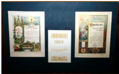
Régi konfirmációs emléklapok a kiállításon