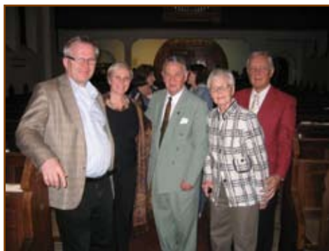
A finn vendégek: a lelkész- és a gondnokházaspár