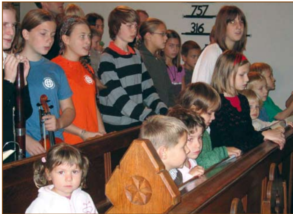
Készülnek a gyerekek is