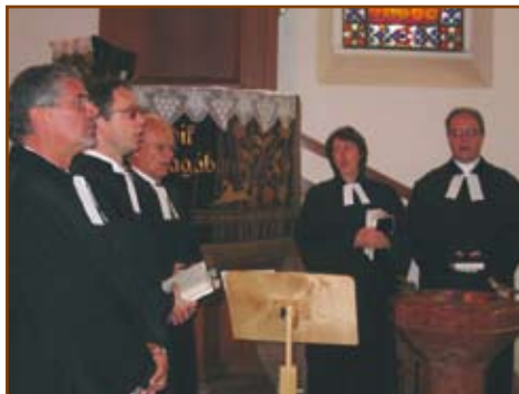
Egykori és jelenlegi kelenföldi lelkészek