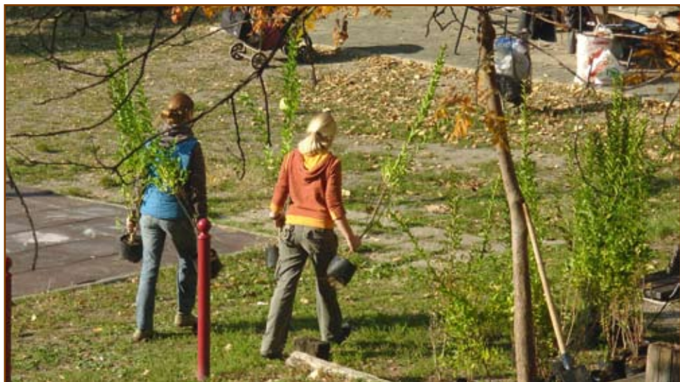
Fásítás a Károli Gáspár téren