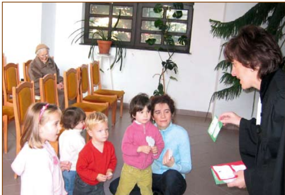
A megérdemelt ajándék