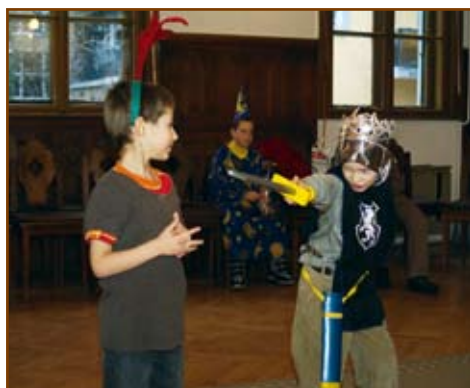
Oroszlánszívű Richárd és „áldozata”