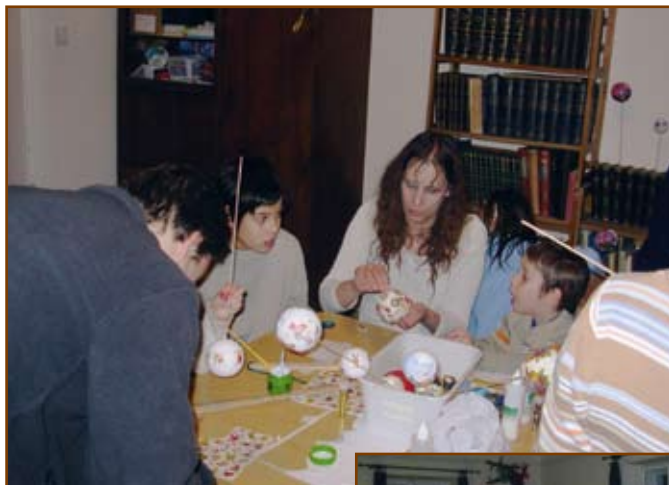
Készülnek a díszek az adventi délutánon