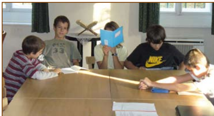
Kiscsoportos munka a konfi órán