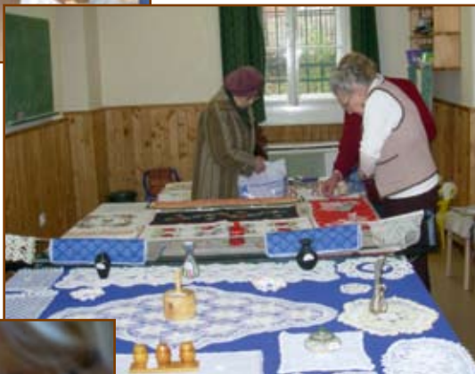
Készülődés a kézimunkakör kiállítására