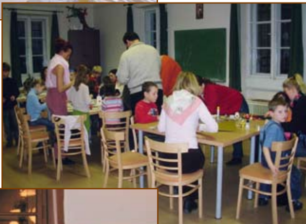
A szorgoskodó „jövő nemzedéke”