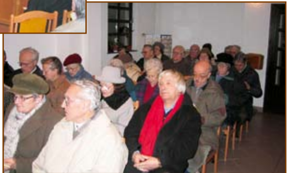
Néhány arc a népes gyülekezetből