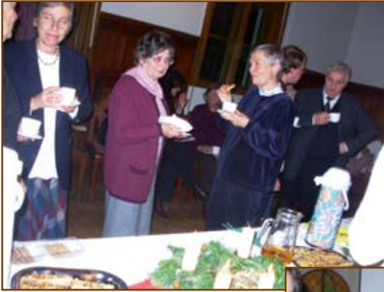
Agapé a munkatársak karácsonyán