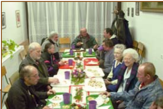
Hajléktalanok karácsonya a Fraknó utcában