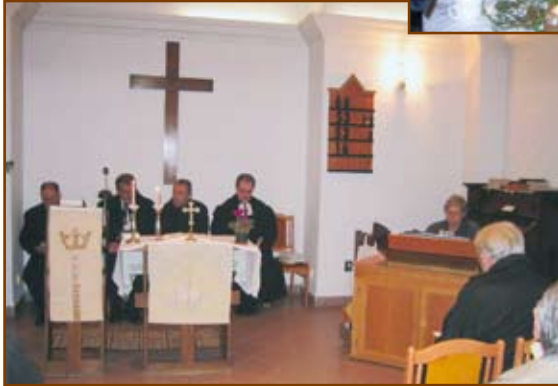
Szolgáltatók a farkasréti ökumenikus istentiszteleten