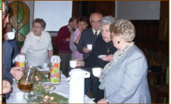
A forralt bor mindenkinek nagyon ízlett