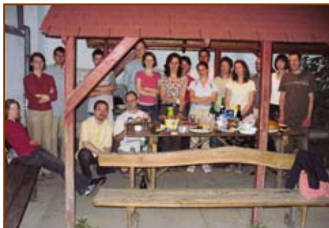
Tanévzáró grillezés a felnőtt ifjúsággal