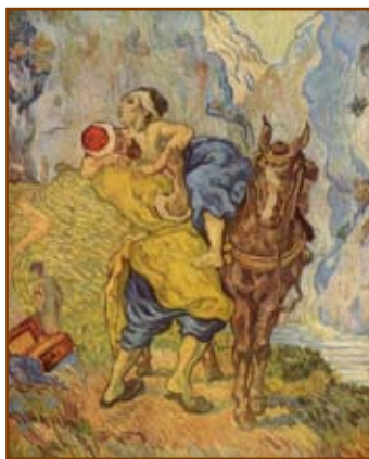
Vincent van Gogh: Az irgalmas samaritánus

Lehet parancsra szolgálni, szeretettel szolgálni? Szép–szép, amit az apostol kér tőlünk, s talán szíves örömet meg is tennénk, ha egyéni életünkben nem lennének gondok, problémák. Manapság igazán nagy a bizonytalanság, vajon mit hoz a holnap?! Elég nekem a magam gondja-baja! Még hogy másokét is magamra vegyem? Előbb oldódjanak meg a saját problémáim! Majd azután lesz időm másokra is.