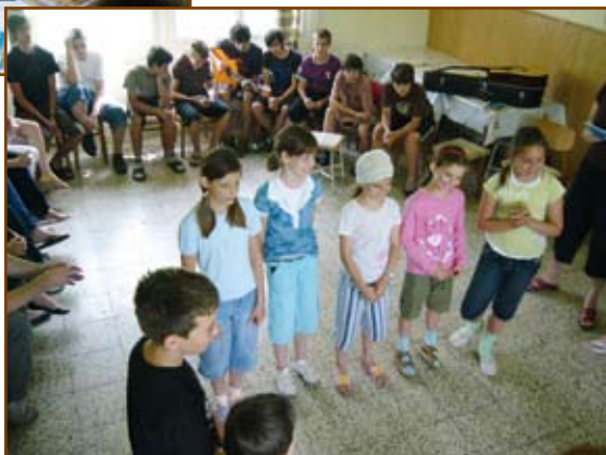
A kicsik szolgálata az ábítaton