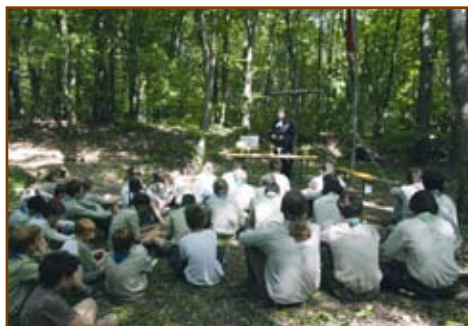
Cserkészistentisztelet az erdőben