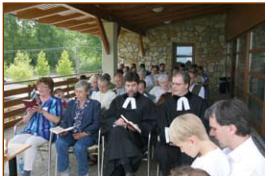
Istentisztelet a teraszon