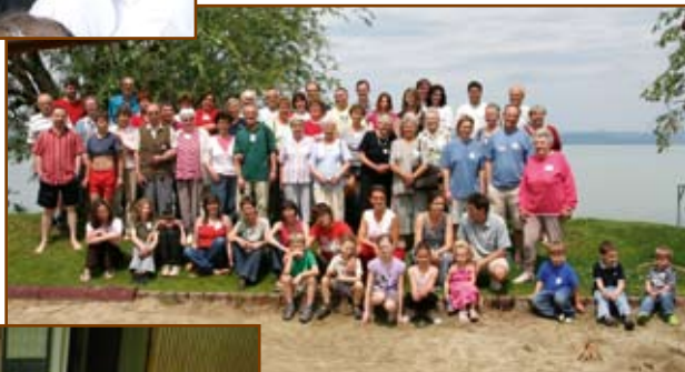
Csoportkép a májusi hétvégéről