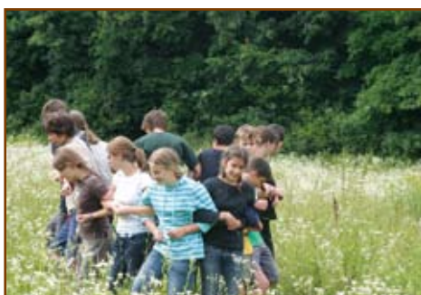
Cserkészjáték a réten