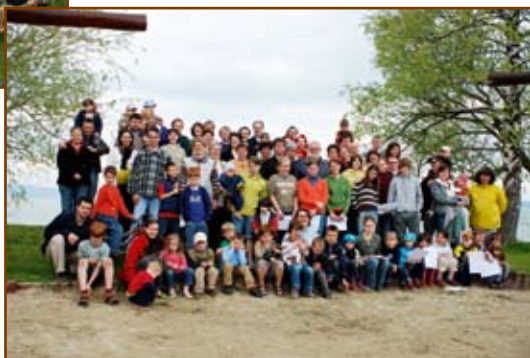
Az áprilisi hétvége résztvevői