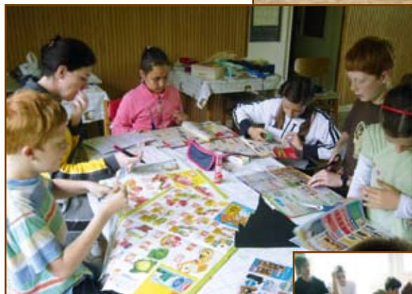
Képek gyermekeink és az ifjúság nyári programjairól