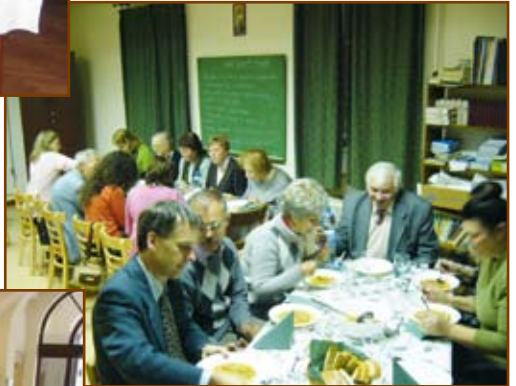
A Gödöllői Királyi Kastélyban