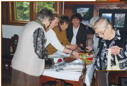
Készülődés a tanácsteremben