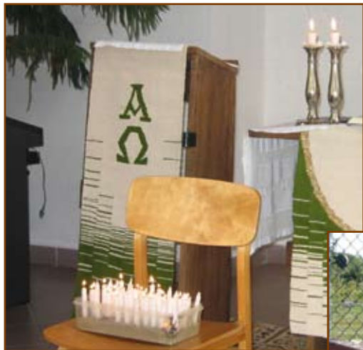
A megemlékező istentisztelet gyertyái Farkasréten