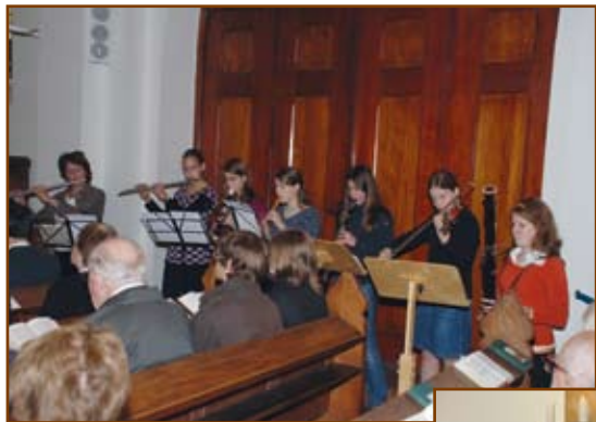
Fiatal zenészek a kezdőénekekben