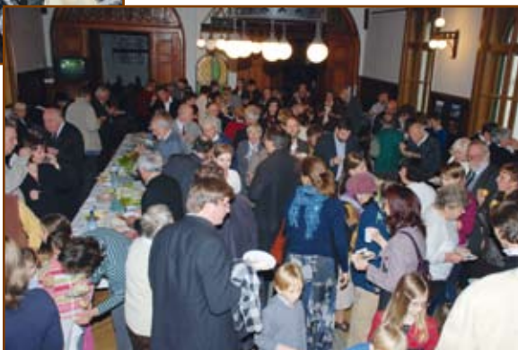
A hétvégét közös agapé zárja