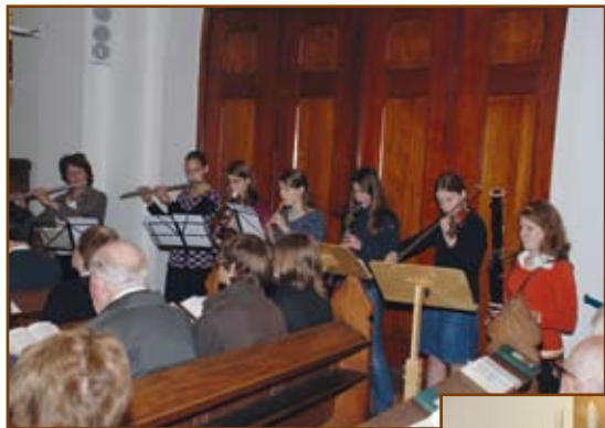
Fiatall zenészek a kezdőénekekben