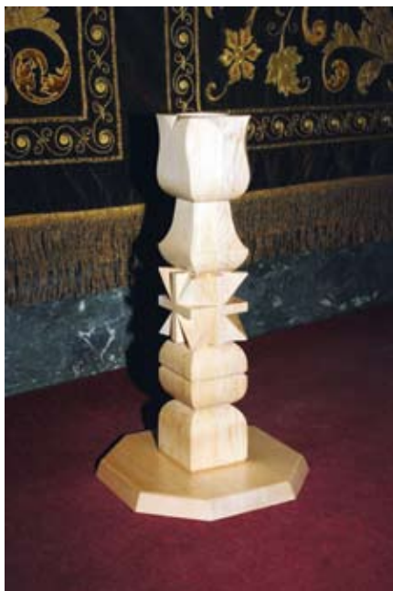
A sepsiszentgyörgyiek ajándéka