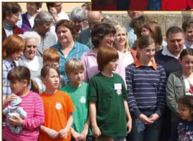
Részlet a csoportképből