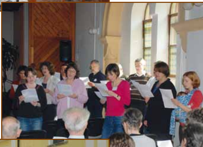
Alkalmi énekkar a záróistentiszteleten