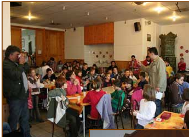
Egyházmegyei bíttanversenyen a kis kelenföldi csapat