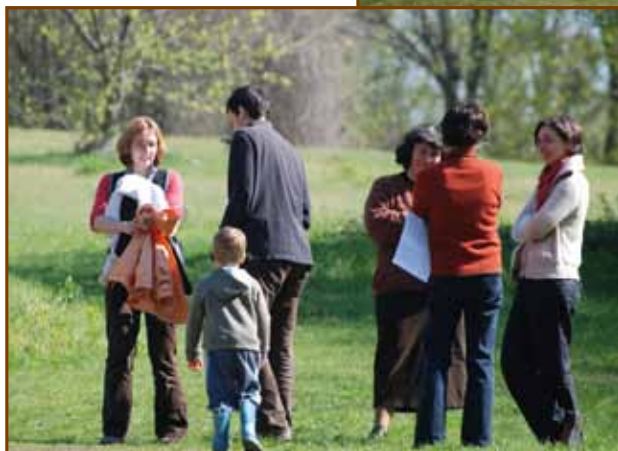
Beszélgetések a szabadban