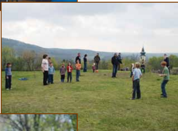
Gyerekvigyzás a szabadban