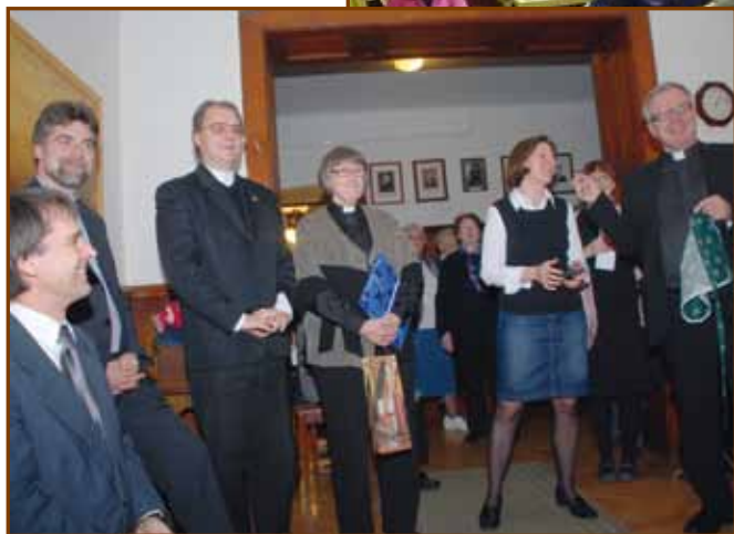
Ajándékozás a finn testvérekkel