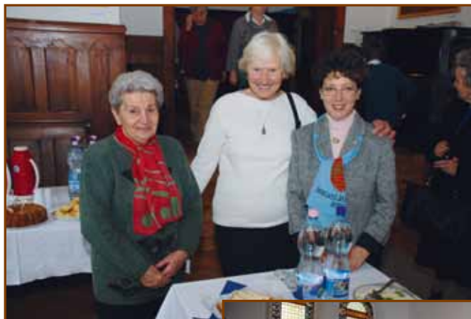
Az ünnep háziasszonyai