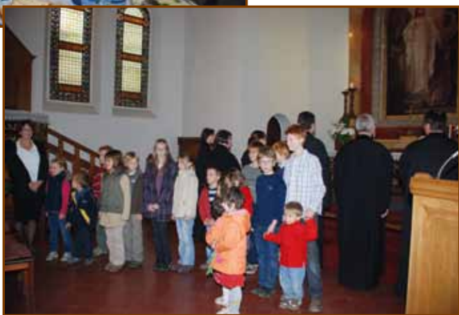
Gyerekek ünnepi éneke