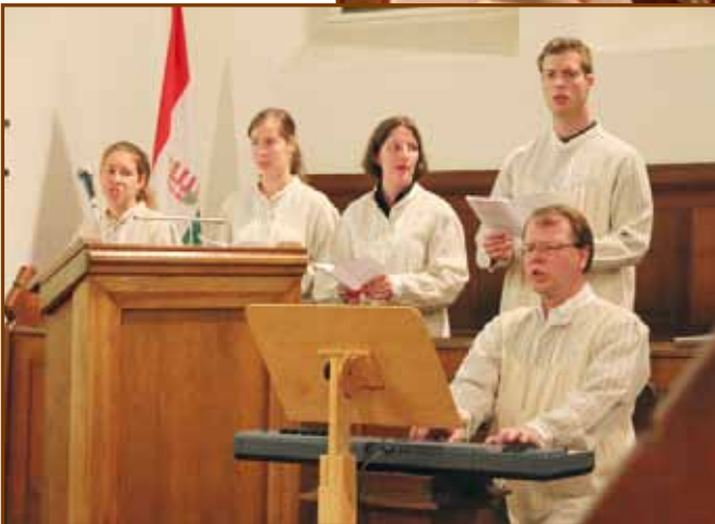
A Fővárosi Protestáns Kántorátus