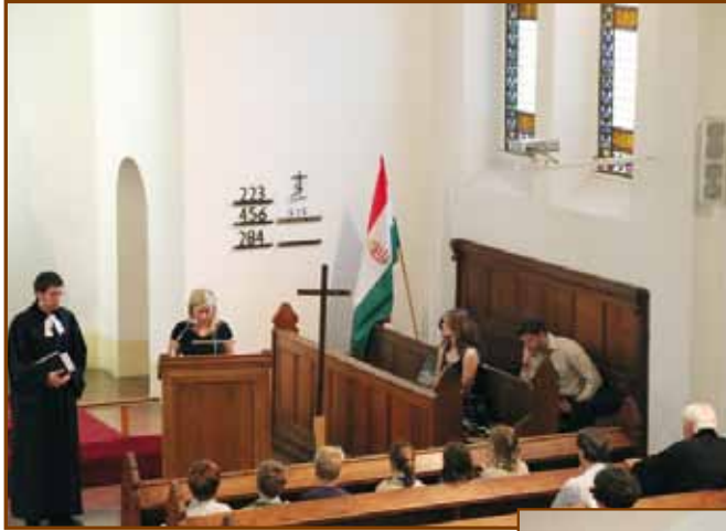
Tanévkezdő családi istentisztelet