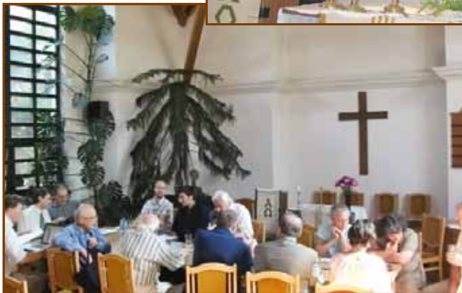
Évkezdő presbiteri ülés Farkasréten