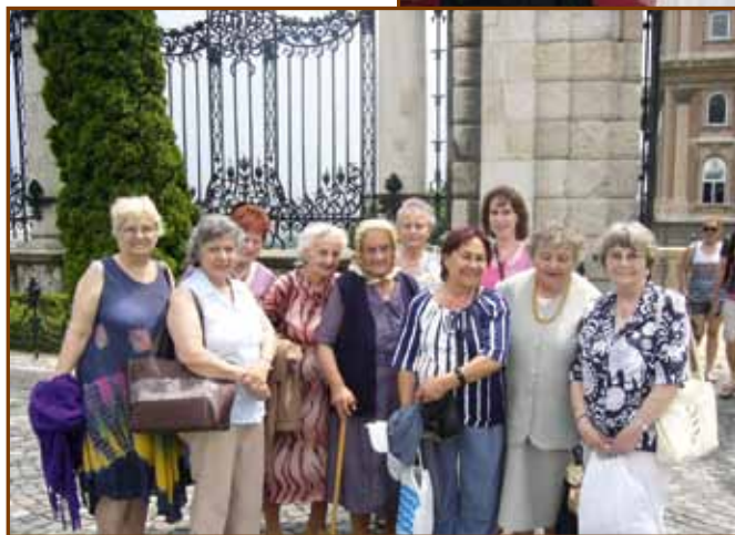
A székesfehérváriak a kelenföldiekkel a budai várban