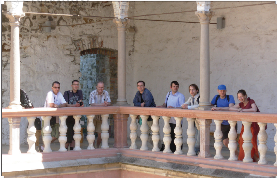
A fiatal felnőttek kirándulása Visegrádon