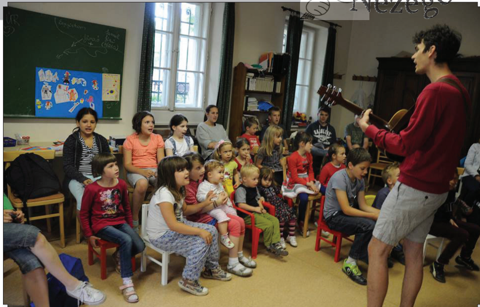
Hittantábor: reggeli dalolás