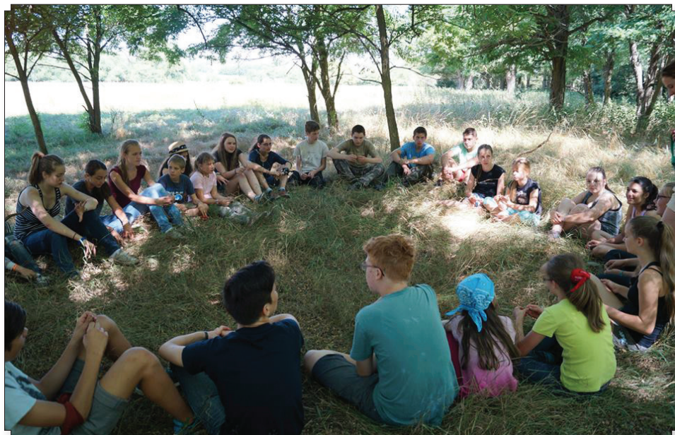
A cserkészek Bokod mellett vertek sátrort