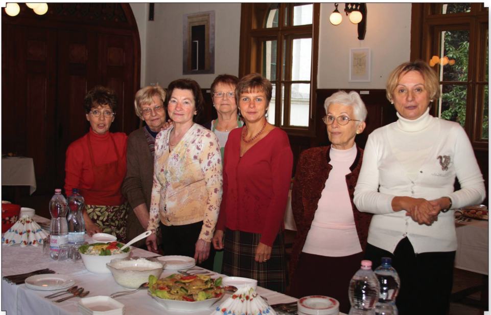
Az agapé háziasszonyai