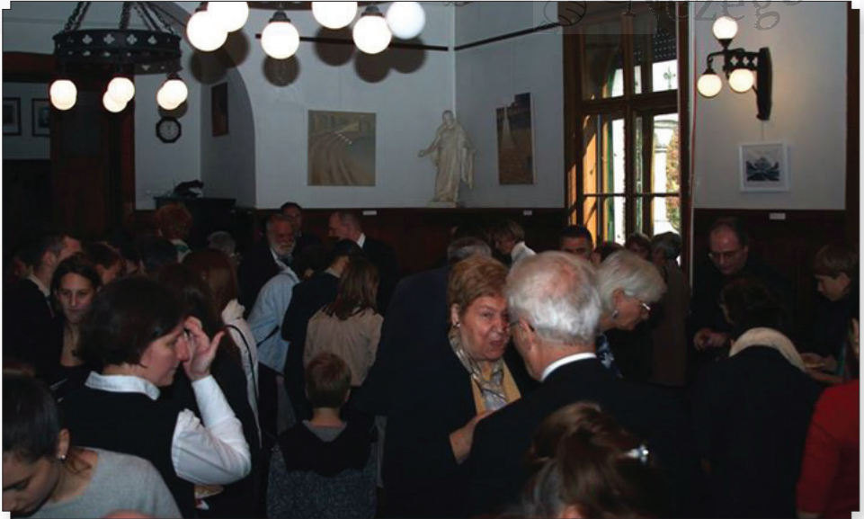
Az istentisztelet után közös ebéden vehettünk részt a tanácssteremben. Köszönet a sok finomság elkészítőinek!