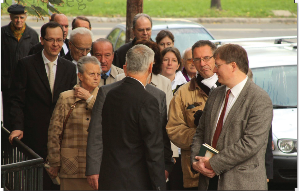
A presbitérium ünnepélyes bevonulása