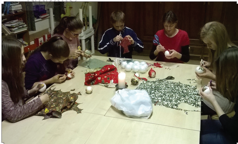
A karácsonyi vásárra készülő kisfisek