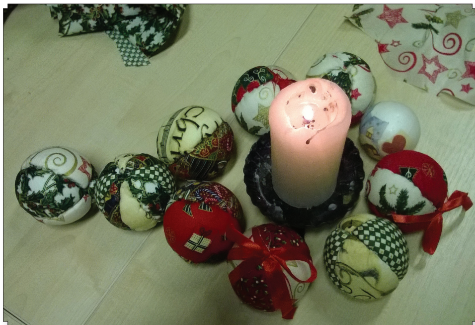
Az elkészült csodaszép vásári portékák