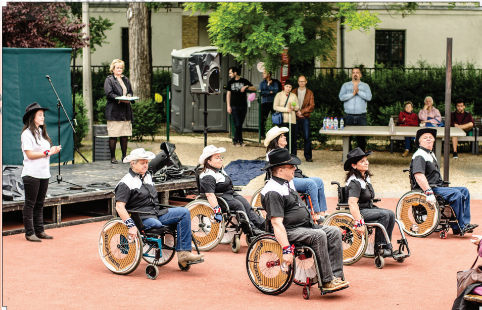
A Rolling Country kerekesszékes táncsoport szívet gyönyörködtető előadása