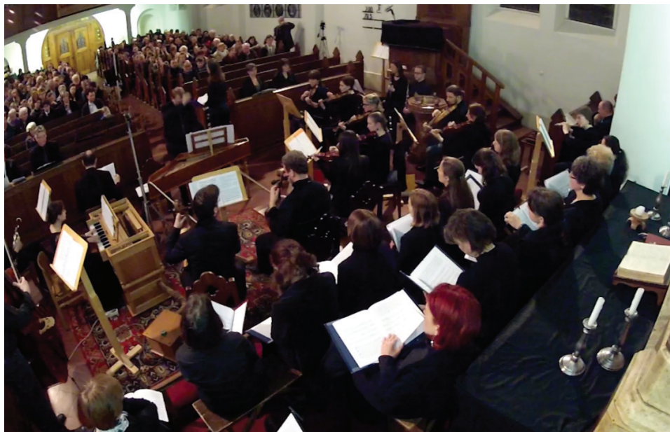
A húsvéti ünnepekör egyik fénypontja a Lukács-passió előadása nagyszombaton