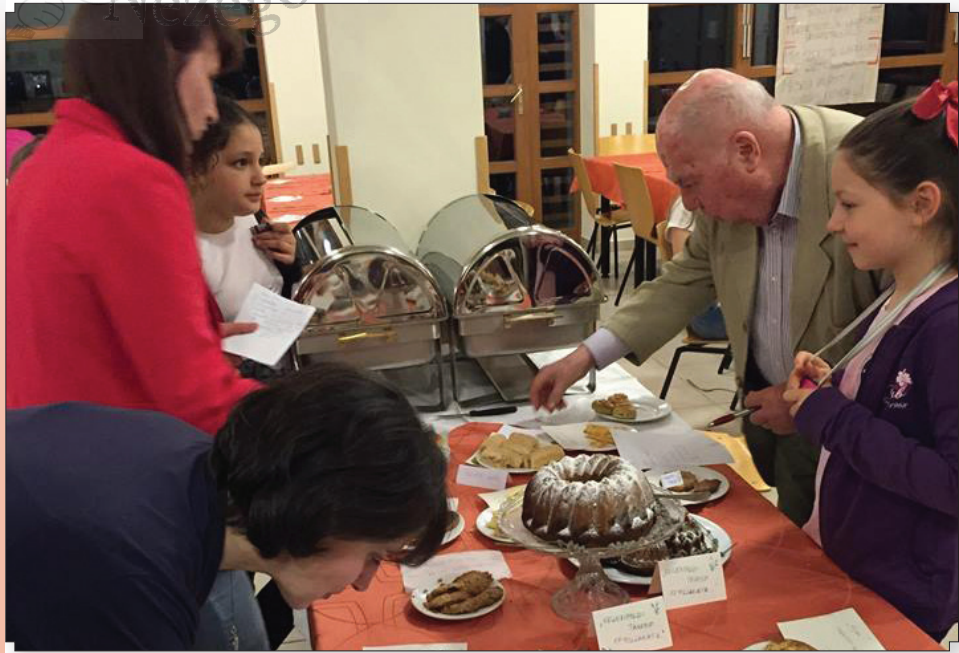
A süteményverseny zsűrije nehezen jutott döntésre a csodás alkotások között