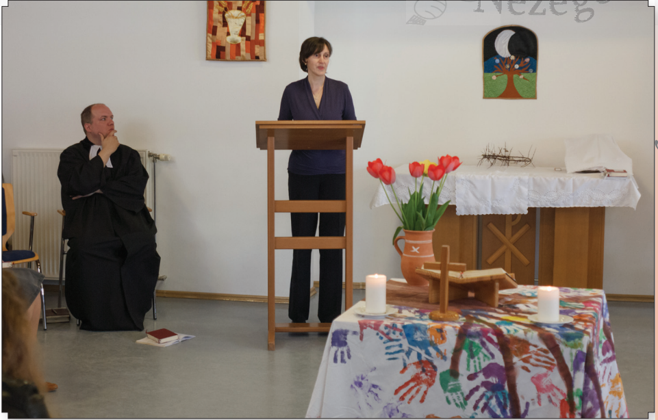
Vasárnapi istentisztelet a gyerekek által készített oltárterítővel