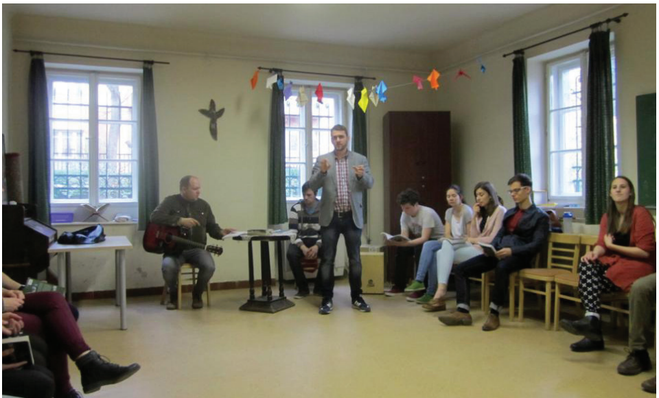
Figyelmes hallgatóság az egyházmegyei ifjúsági napon