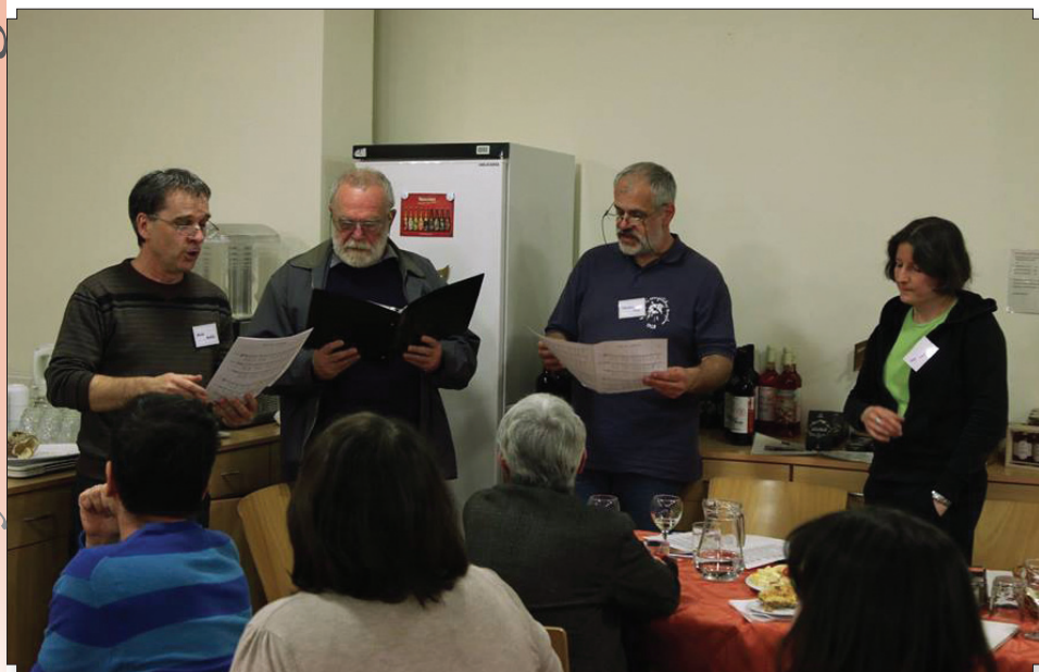
Múlt és jelen – a felügyelők nagy sikerű bortalai