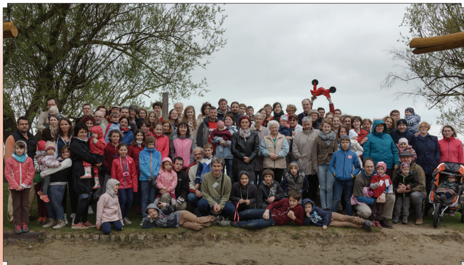
Jókedvű csoportkép a borús időben