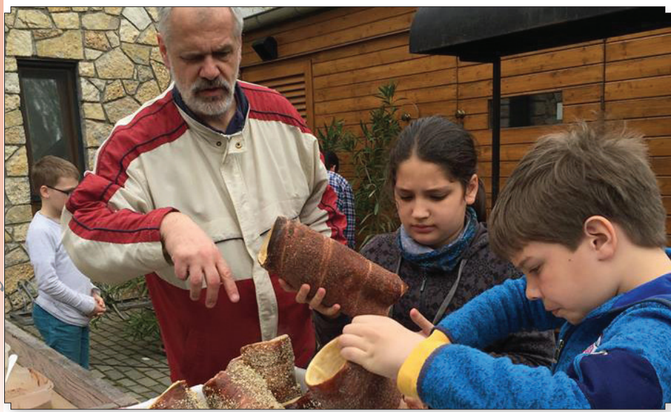
Ínycsiklandó kürtöskalács-készítés kicsikkel és nagyokkal