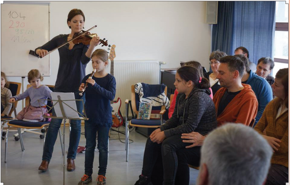
Anya-lánya duó tette még színesebbé az istentiszteletet