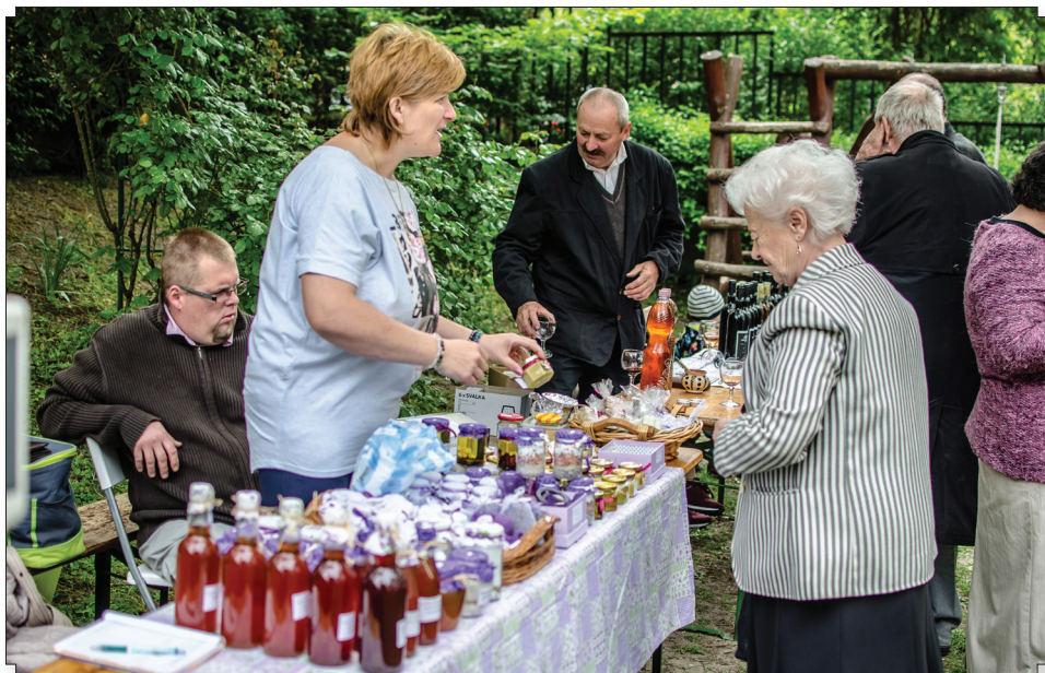
Nem volt könnyű a választás a sok finom kézműves termék közül