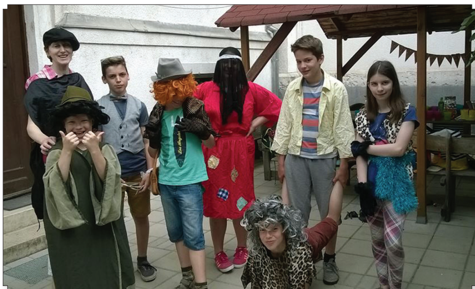
Hittantábor – nyáron is jelmezben