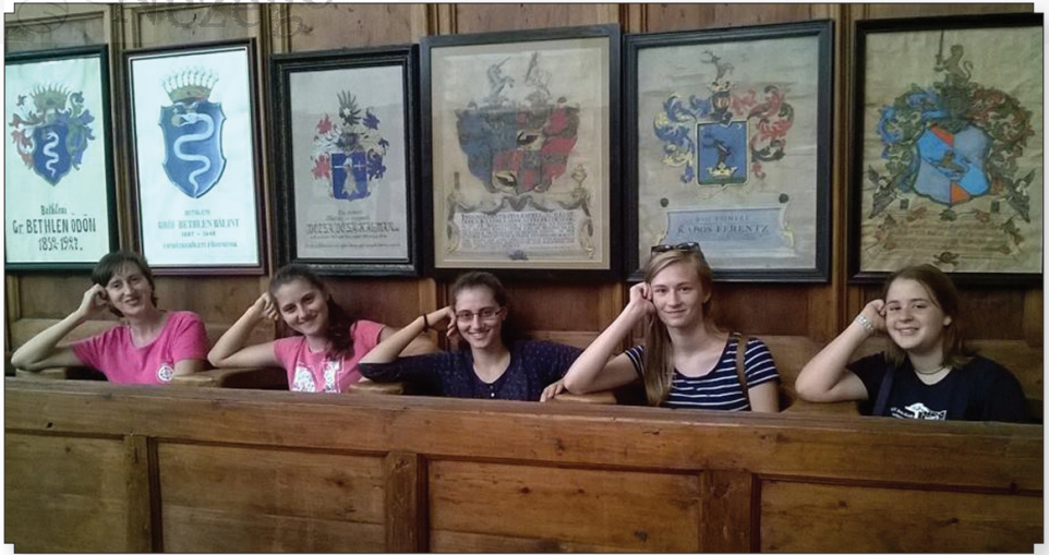
Múlt és jelen