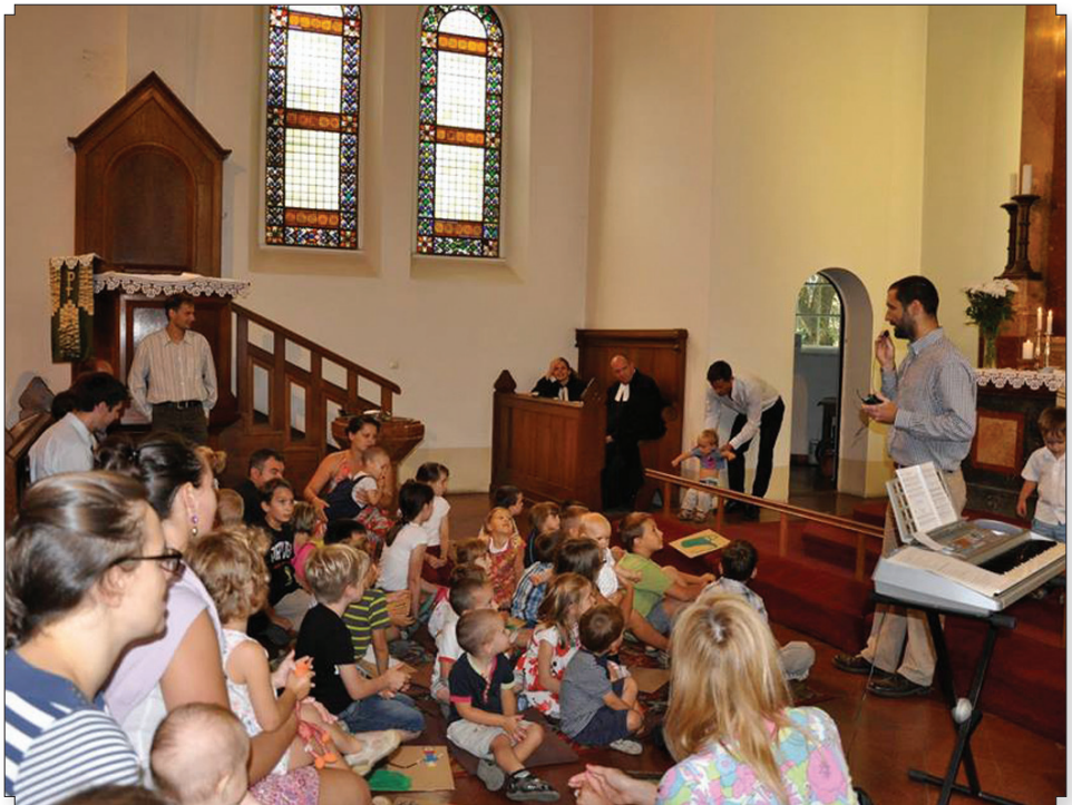
Tanévnyitó családi istentisztelet