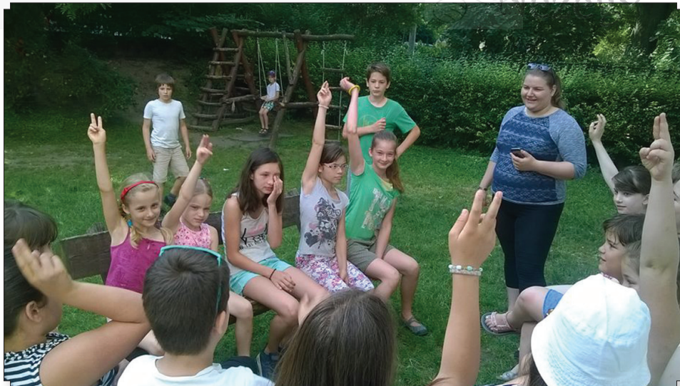
Hittantábor – én is, én is!!!