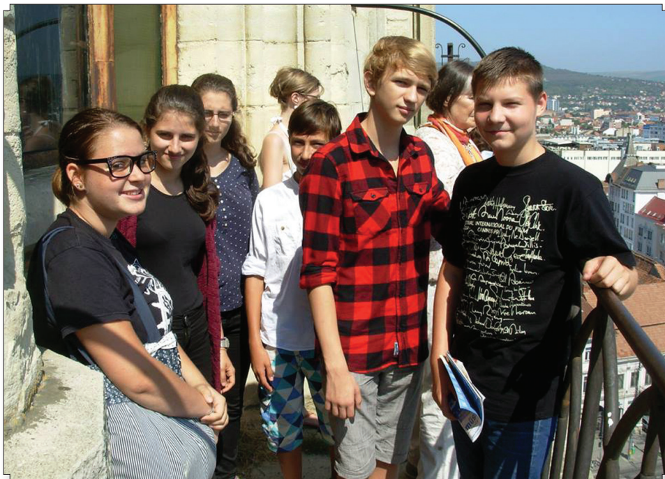
Kisifisek a hétszáz éves Kolozsváron