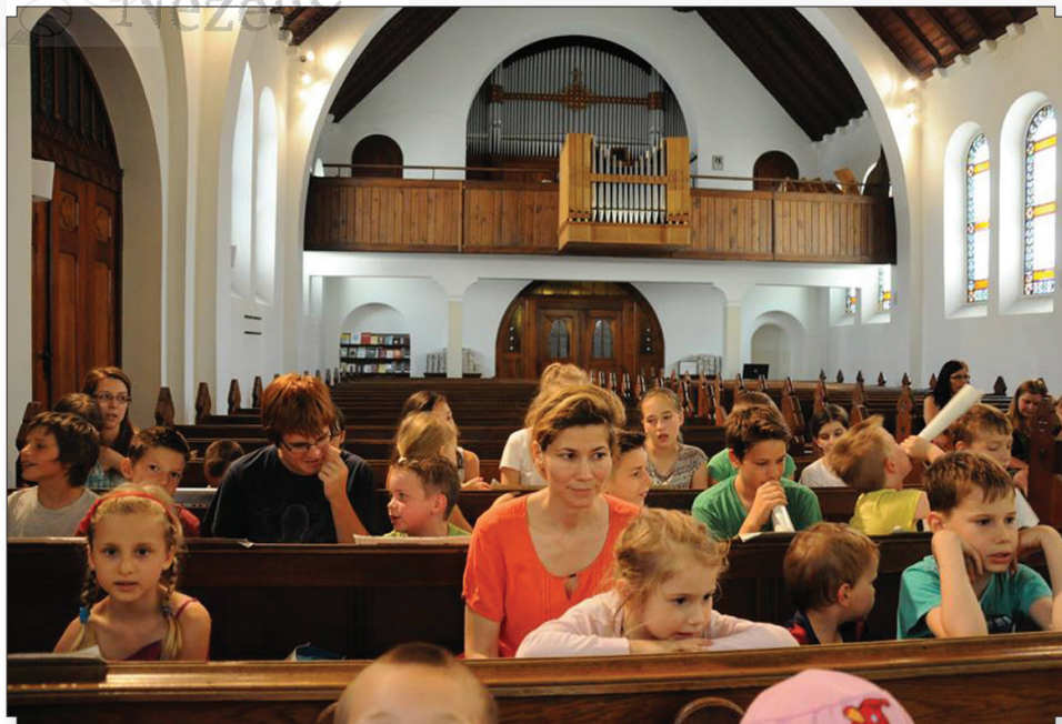
Hittantábor – vajon milyen lesz?