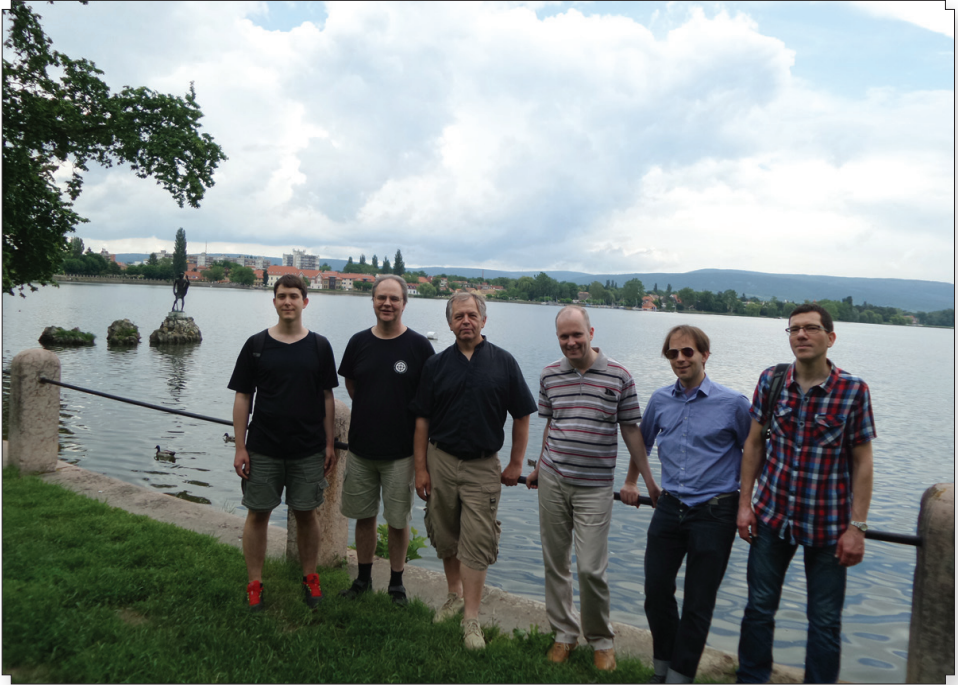
Tatára kirándult a fífasok csapata