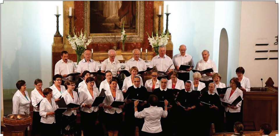
Föld sója keresztény találkozó – Kelenföld, július 8–9.