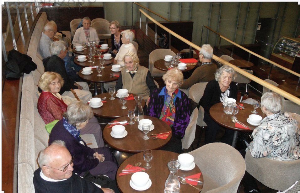
Idős testvérek Székesfehérváron