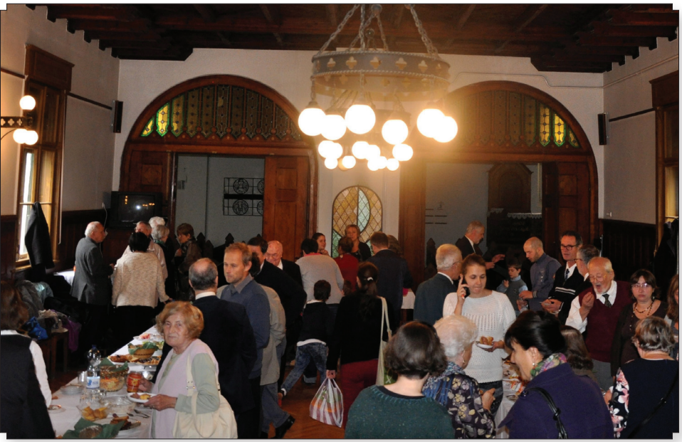
A közös ebéd jó alkalom az ismerkedésre, beszélgetésre is