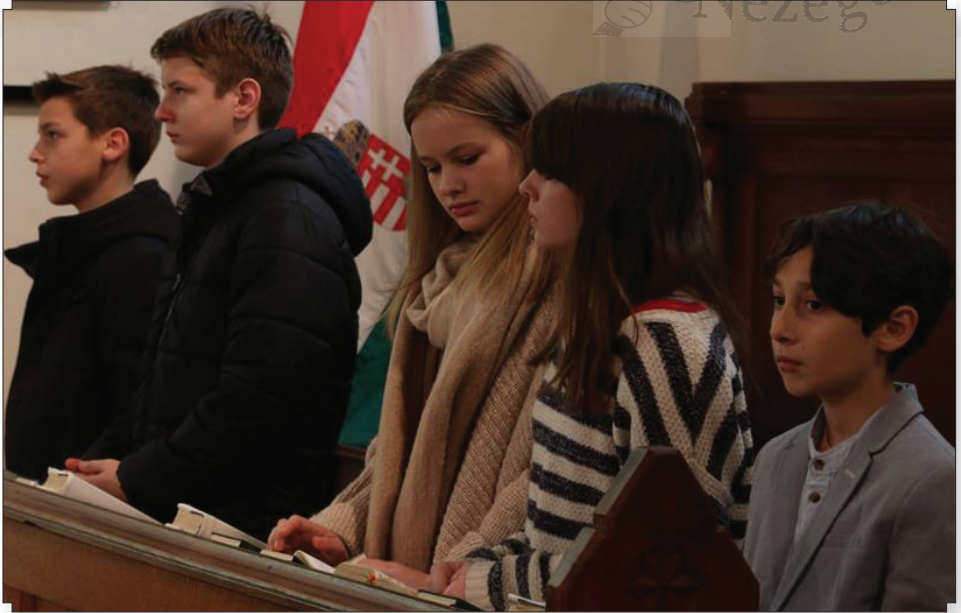
A konfirmandusok bemutatkozása