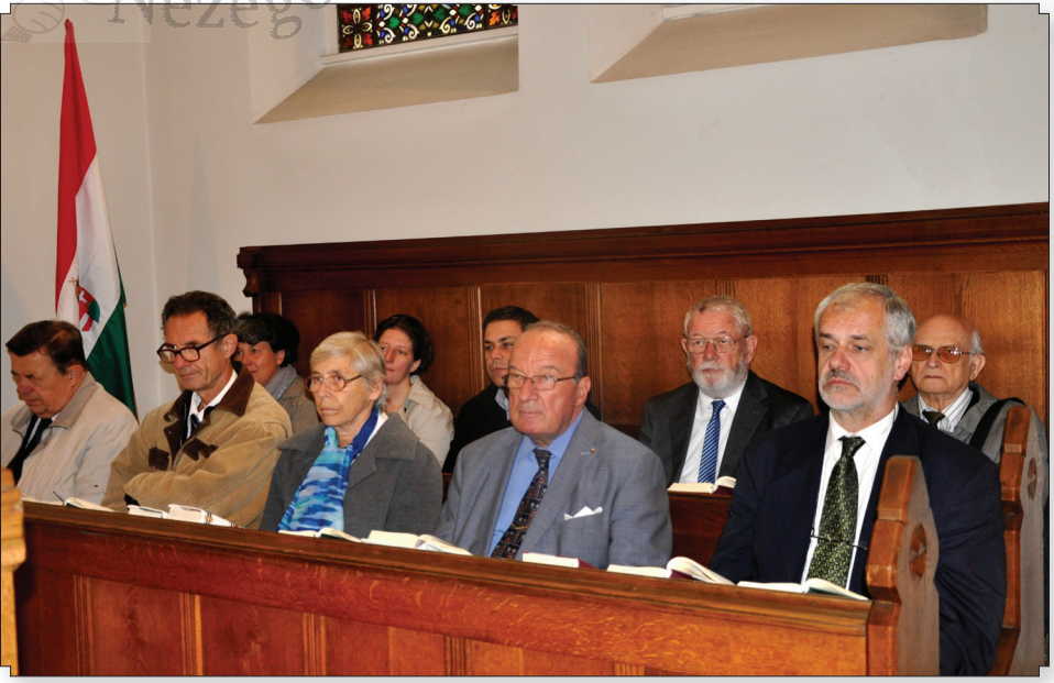
Ilyenkor a presbiteri pad is használatba kerül