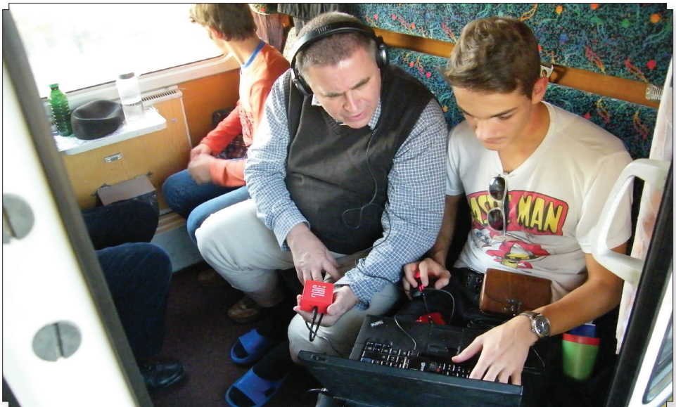
A közös érdeklődés a hosszú vonatutat is kellemesebbé teszi