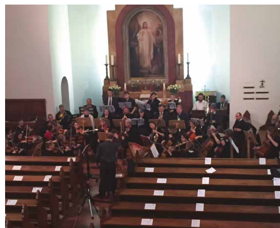
A szombati koncert