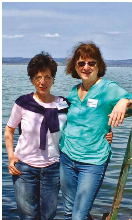
Itt kezdődött az érdemi munka

- Van-e már valami visszhangja a könyvnek?