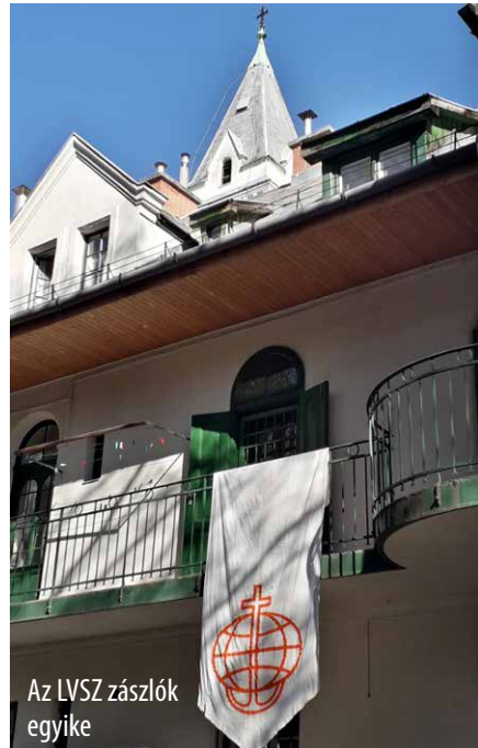
Az LVSZ zászlók egyike