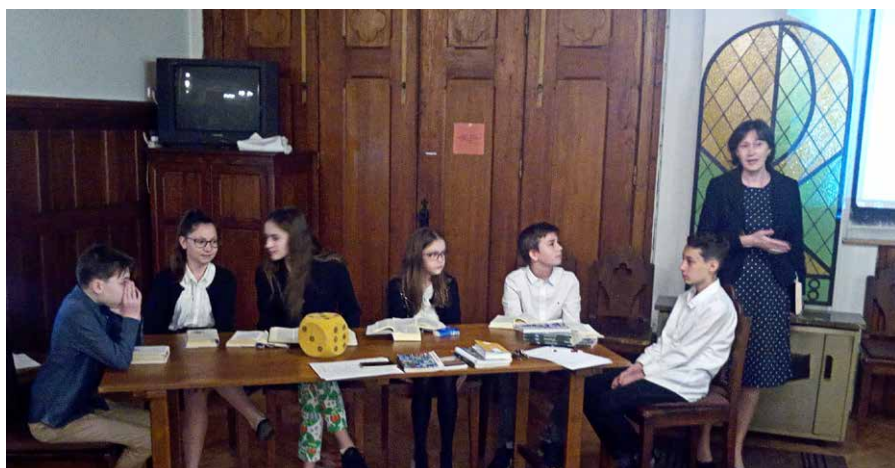
Piliscsabai konfirmandus hétvége