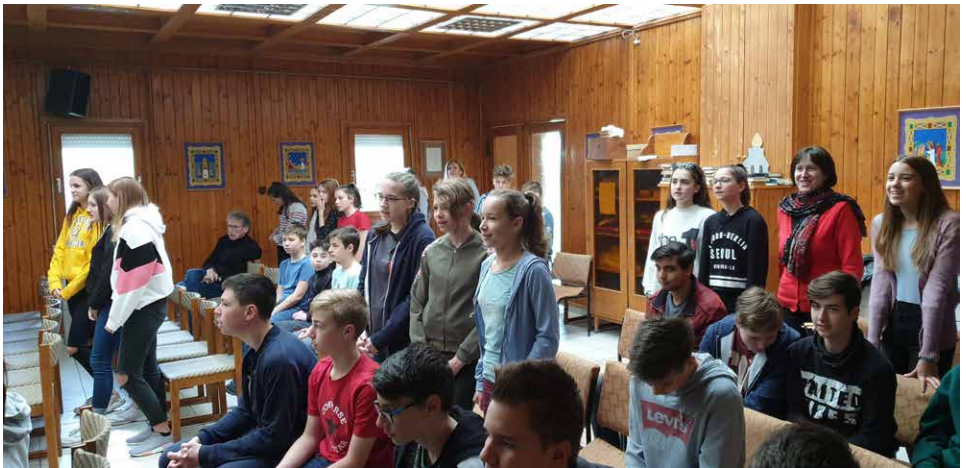
piliscsabai konfirmandus hétvége