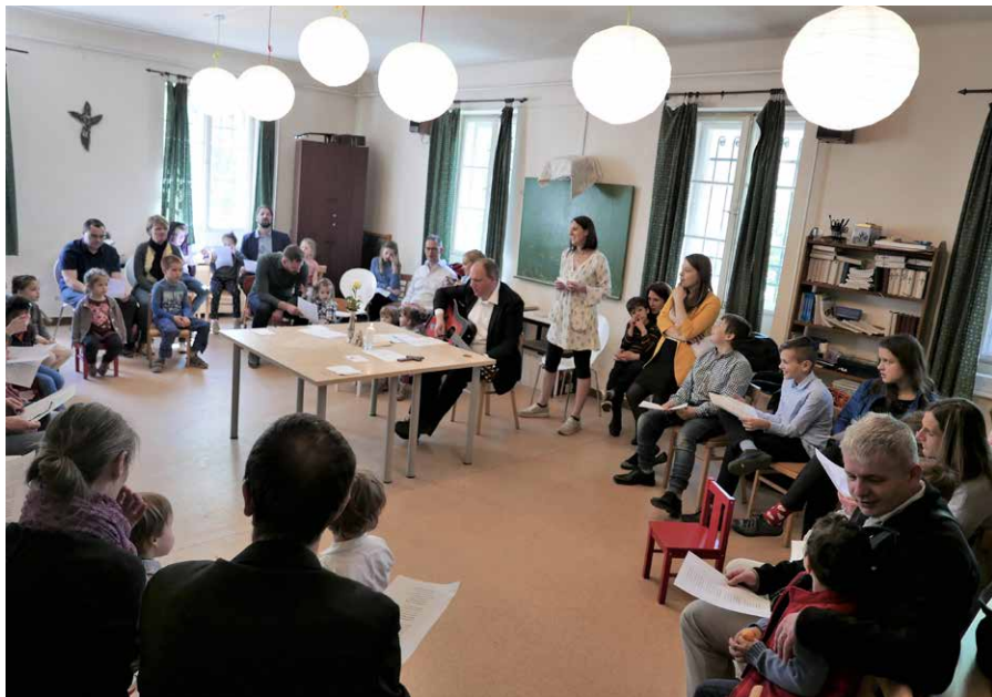
„Neveden szólítottalak” - húsvéti gyermekistentiszelet 2019