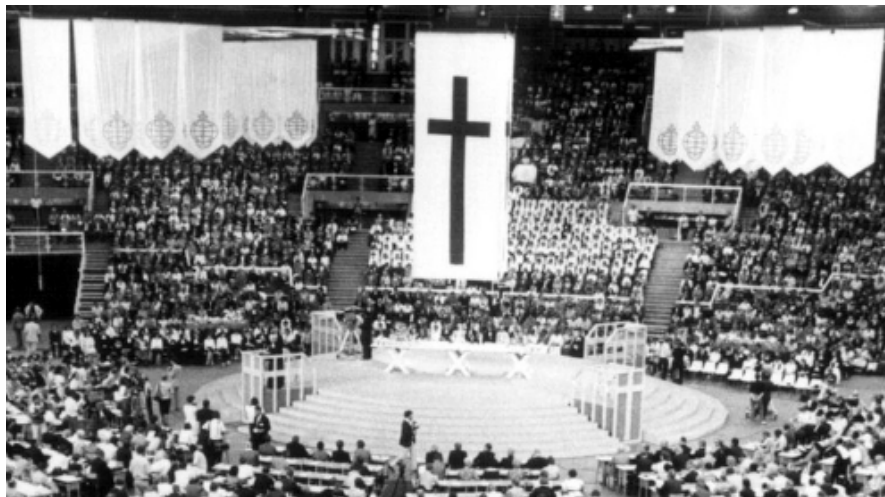
Az LVSZ nagygyűlés zászlói a Budapest Sportcsarnokban (1984)