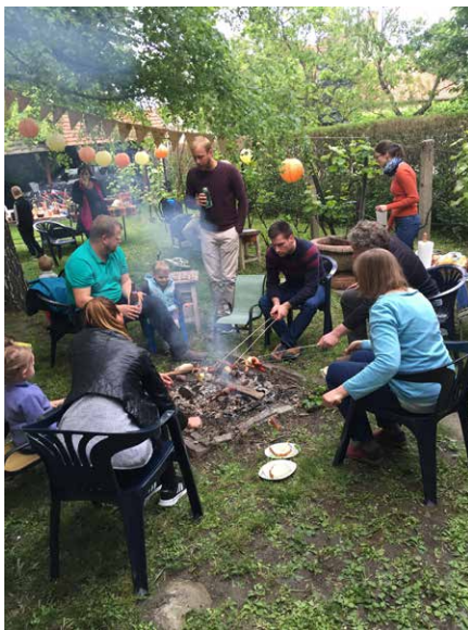
A lakásifi május 17-én tartotta grillpartival egybekötött évadzáró alkalmát