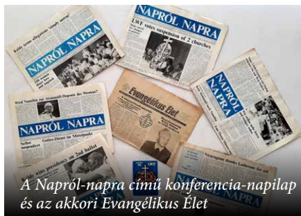
A Napról-napra című konferencia-napló és az akkori Evangelikus Élet