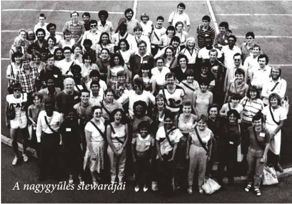
A nagygyűlés stewardjai

a budapesti kongresszusnak sikerült újabb részt ütnie az évtizedekkel korábban kelet és nyugat között emelt és lebonthatatlanak tűnő vasfüggönyön.