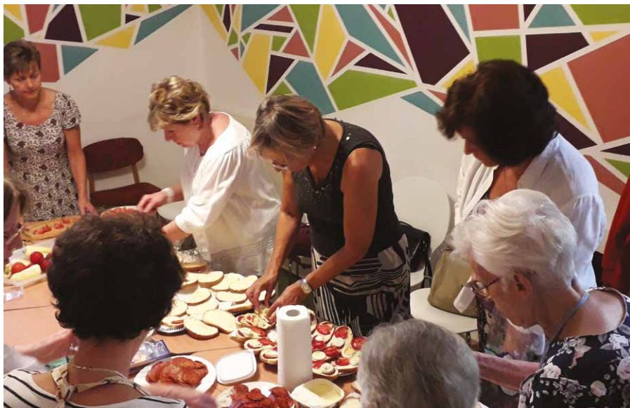
Szendvicskészítés a közös ünnepléshez