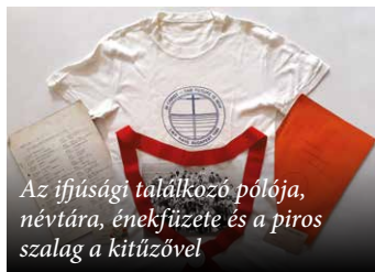
Az ifjúsági találkozó pólója, névtára, éneközete és a piros szalag a kitűzővel