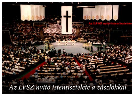
Az LVSZ nyitó istentisztelete a zászlókkal