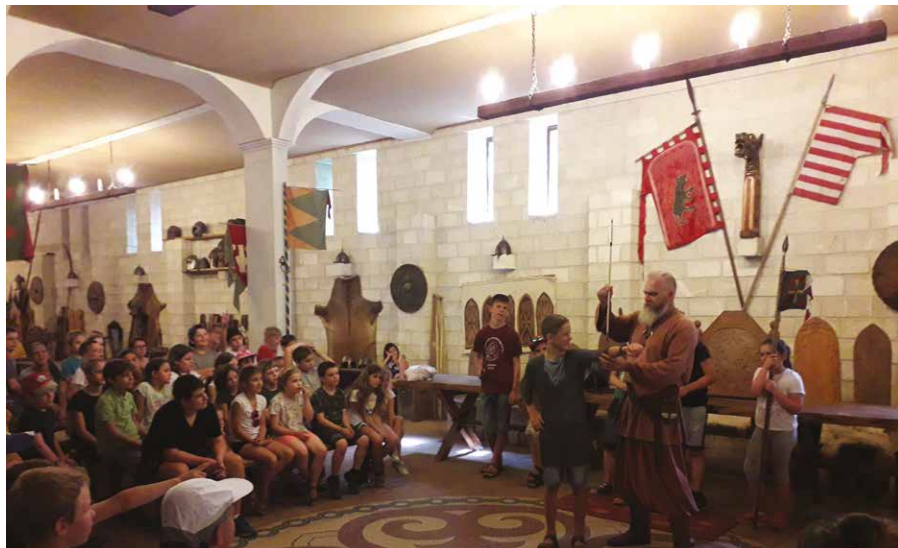
Emese park, bemutató