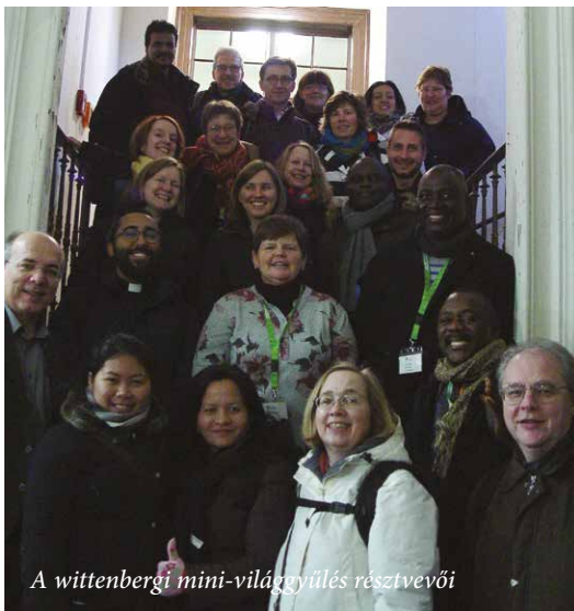
A wittenbergi mini-világgűlés résztvevői