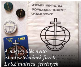
A naggyűlés nyitó istentiszteletének füzetek, LVSZ matrica, jelvények