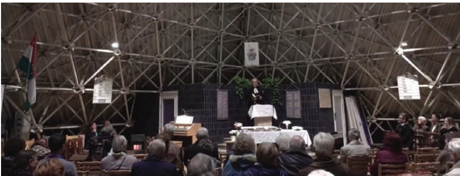
Az ünneplő gyülekezet