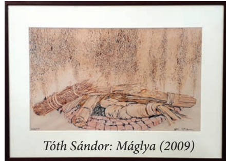
Tóth Sándor: Máglya (2009)

Tóth Sándor textilművész alkotásaiban, grafikáin különös hangsúlyt kap a különböző anyagok együttes felhasználása.