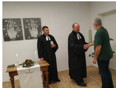
Gyülekezeti terem szentelés