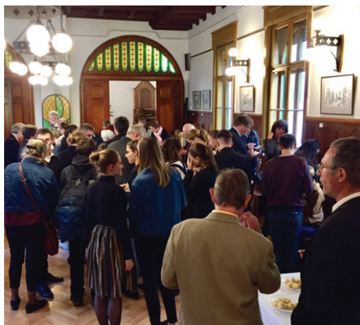
A terített asztaloknál