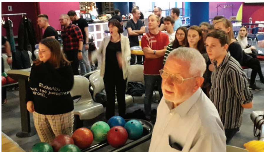
Bowlingozás a Kisifivel