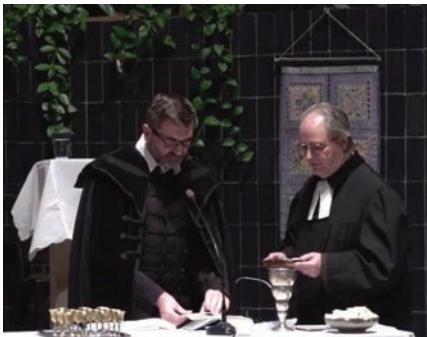
A reformációi istentisztelet szolgálattevői