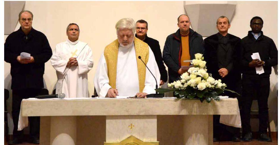
Imahét a Szt. Gellért templomban és a Szt. Imre kápolnában