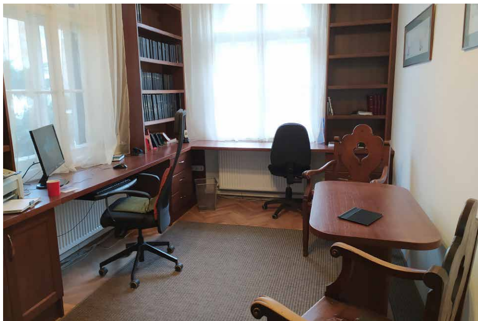
A lelkészi hivatal új bútorzata a tavalyi áldozati vasárnap gyűjtésének eredménye