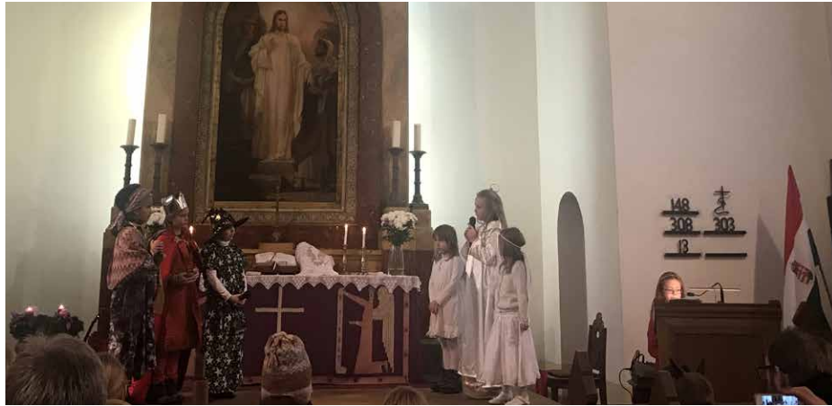
Karácsonyvárás: angyalok és bölcsek