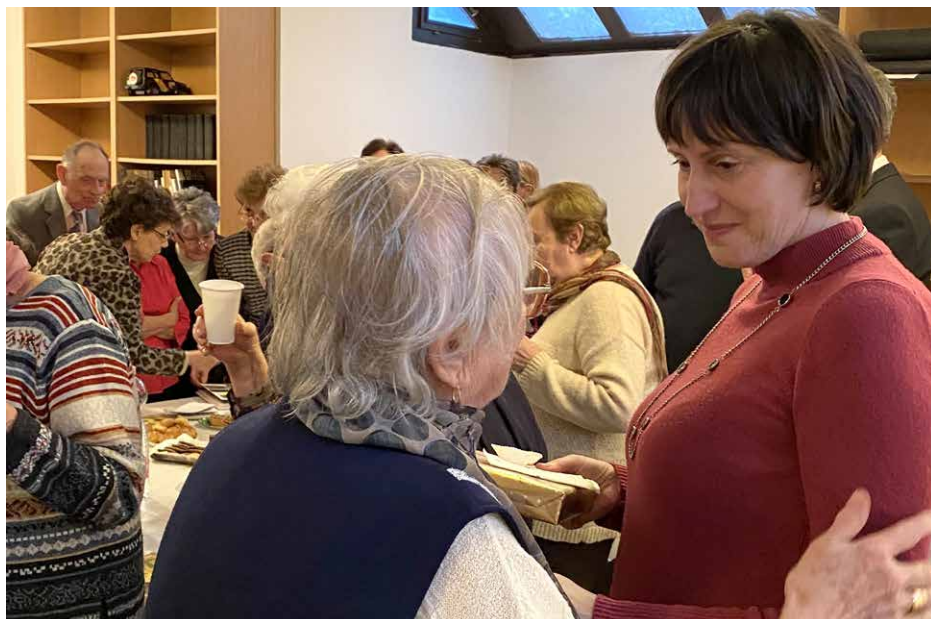
Beszélgetésre is volt alkalom