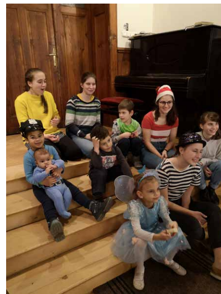
Farsang 2020 a cserkészek szervezésében