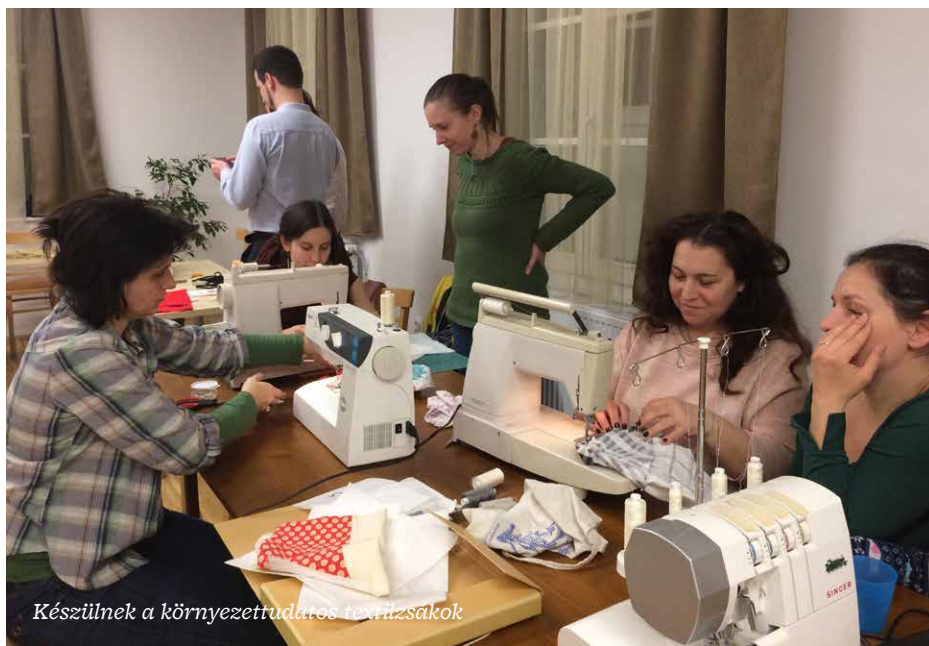
Készülnek a környezettudatos textilzsakok