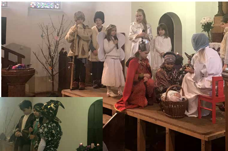
Hódolat a kis Jézus előtt