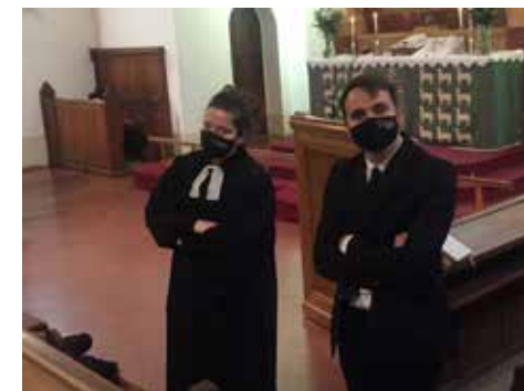
A novemberi gyermekistentiszteletre várva