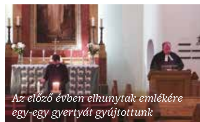
Az előző évben elhunytak emlékére egy-egy gyertyát gyűjtöttünk