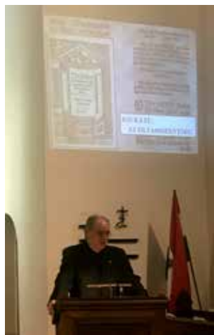
Felnőtt-katekézis az Őszi Gyülekezeti Hétvégén