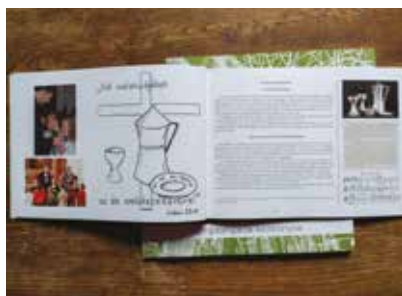
Új könyvünk 1000 Ft-os áron megvásárolható az iratterjesztésünkben