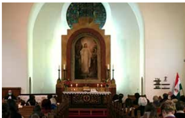
Életkép a 92 éves templomunkból