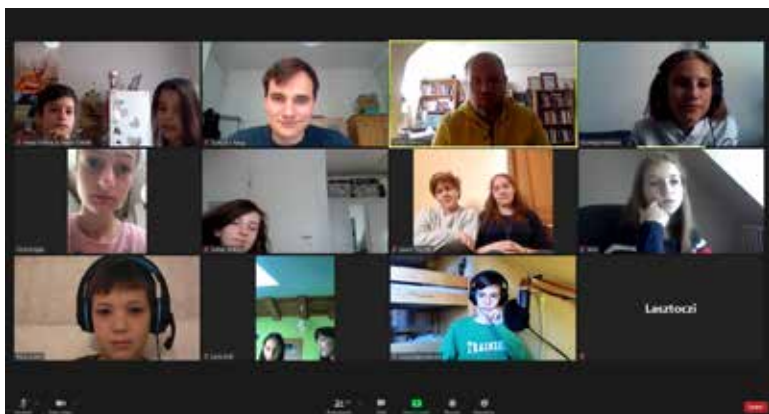
Novemberi konfirmációs oktatás zoomon