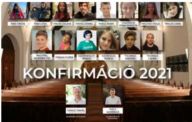
Konfirmációs tábló 2020/2021