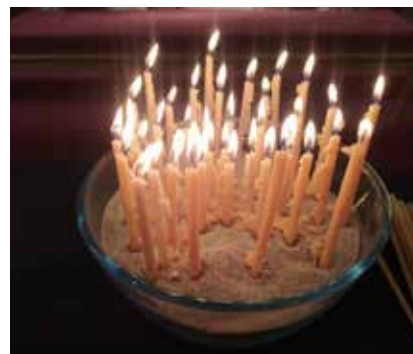
Örök élet vasárnapján megemlékeztünk előremet szeretteinkről