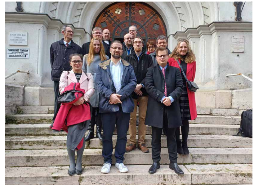
Presbiterek - esküdtétel után

Nyári gyülekezeti táborunk tervezett időpontja: 2024. június 24-28. A részletes programot, a jelentkezési lehetőséget a következő hetekben hirdetjük.