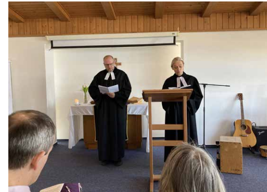
Dialogus-prédikáció az istentiszteleten