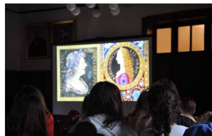
Filmnézés a cserkészgálán