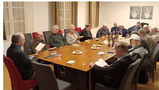
A FÉK évkezdő alkalma