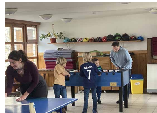
Pingpong- és csocsópartik