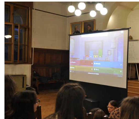
Kvízjáték a gálán