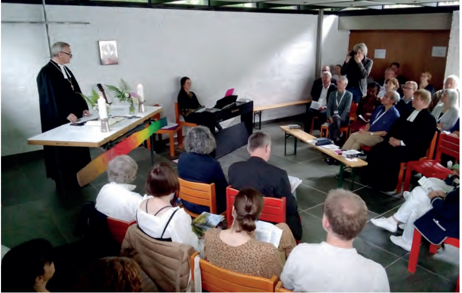
Ökumenikus istentisztelet Josefstalban