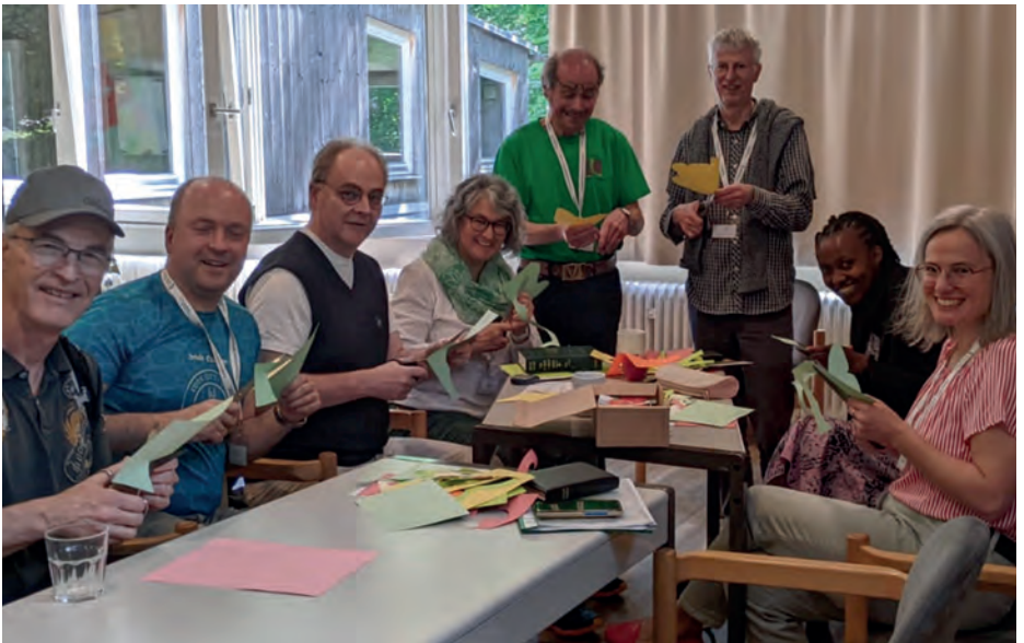
Igéslapok készülnek Josefstalban