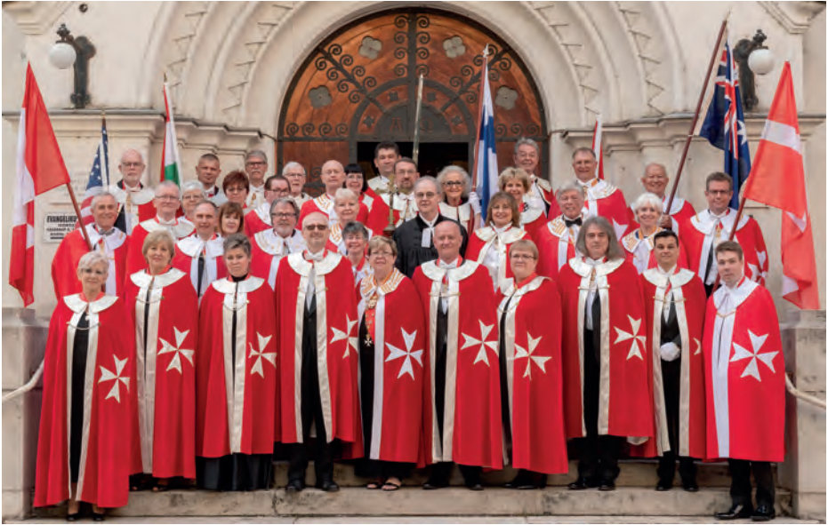
A Szt. János lovagrend avatóünnepségének résztvevői