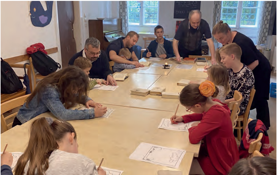
Pünkösdi gyermek istentisztelet