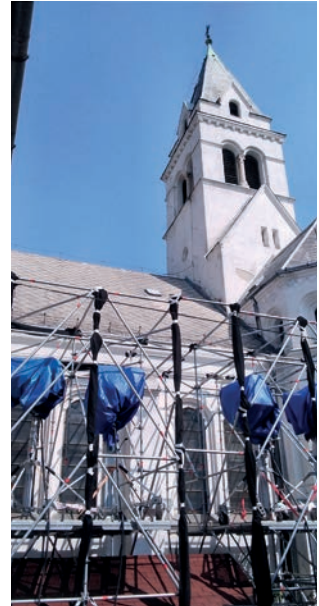
Templomunk reflektorokkal körbástázza