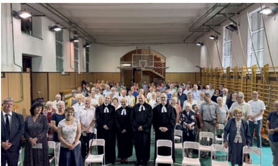
A jubileumát ünneplő gyülekezet