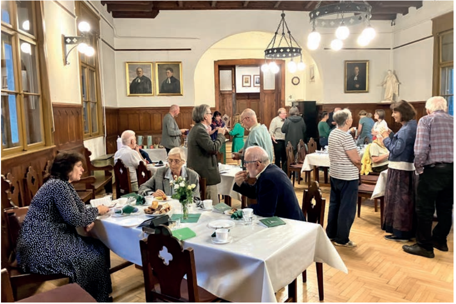
A Boltív esték első alkalma