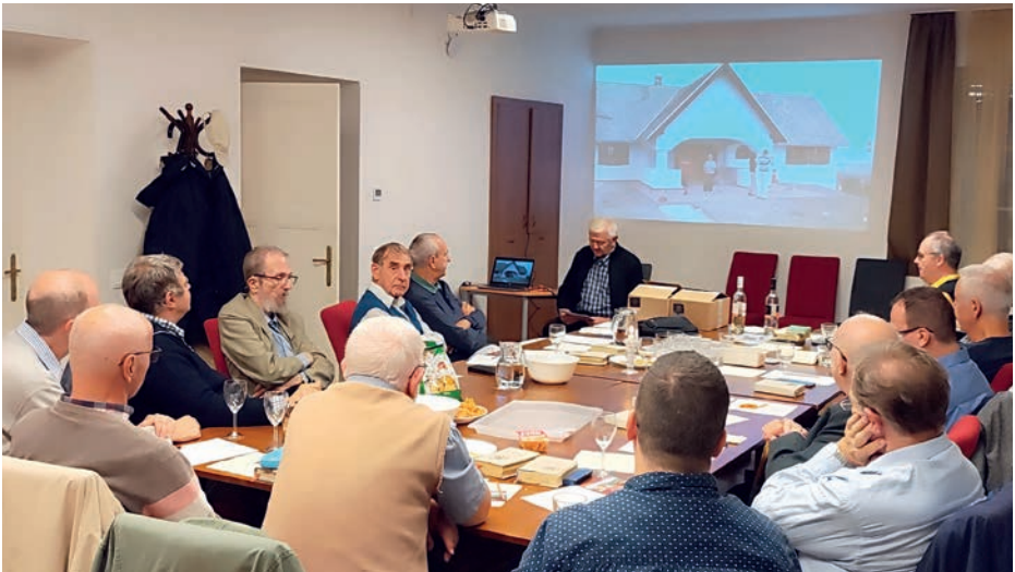
A FÉK évkezdő alkalmá