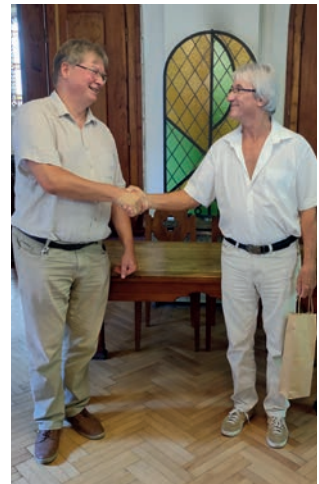
A kelenföldi és a kötcsei felügyelő kézfogása a közös istentisztelet után