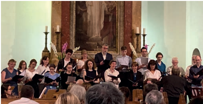
Ének és zenekarunk tanévzáró hálaadó istentisztelete