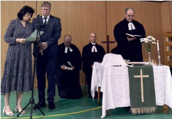
Szolgálattelvők a tornatermi istentiszteleten