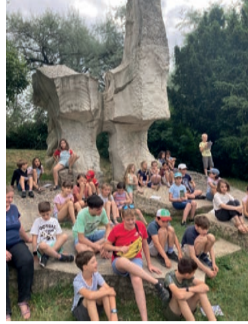
Hittantábor-áhitat a Feneketlen tó partján