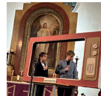
karácsonyi műsor a templomban