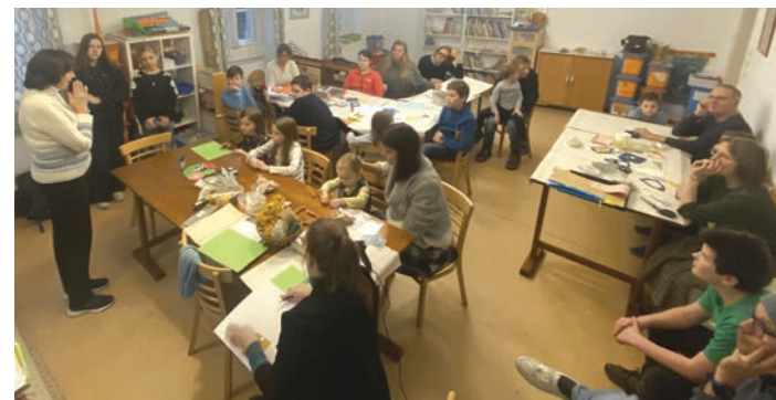
Áhítat a kézműves délutánon