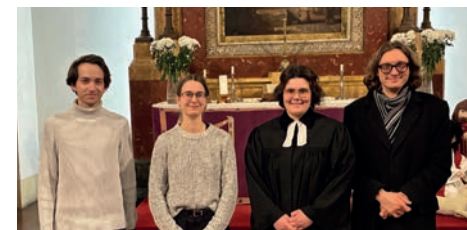
ádventi zenés áhítat fiatal szolgálattelvői