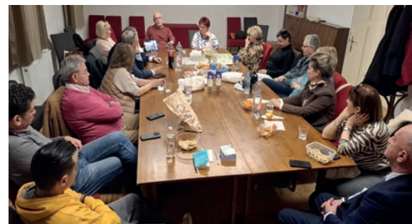
Kórházasi lovagok tanácskozása