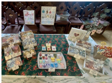
Ádventi vásár – kitűzők