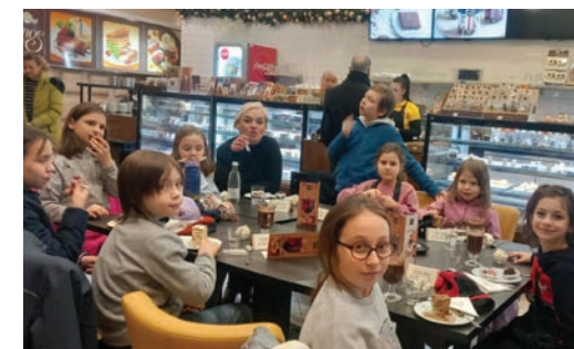
bibliakuckósok a cukrászdában