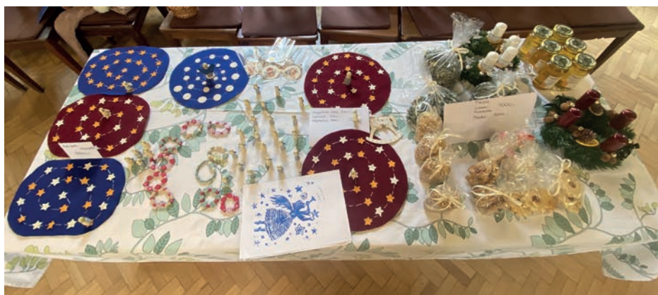
Ádventi vásár – ajándékok – finomságok