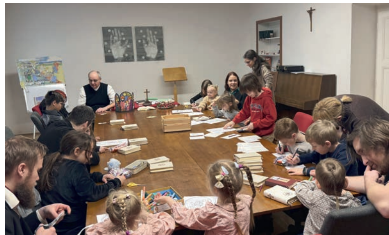
Karácsonyi gyermek Isten-tisztelet