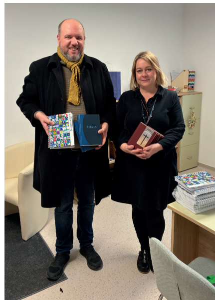
A gyülekezet karácsonyi ajándékainak átadása

Intézményünk szülői közösségének szervezésében került megrendezésre a Fügefa ovi első, hagyományteremtő Szülői Estje, melynek a kelenföldi gyülekezet adott otthont, ezúton is köszönjük a lehetőséget a gyülekezetnek.