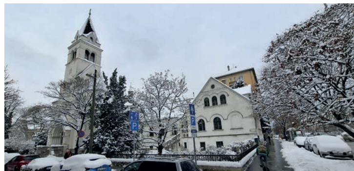
Január elején beköszöntött a tél