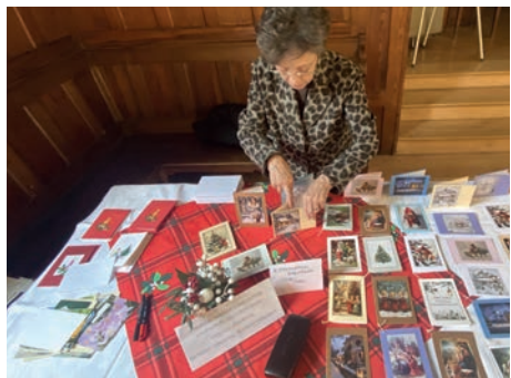
Ádventi vásár – képeslapok