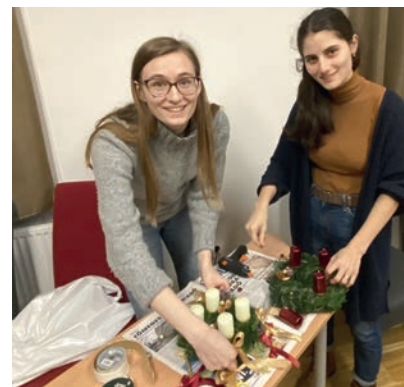
Készülők a koszorúk