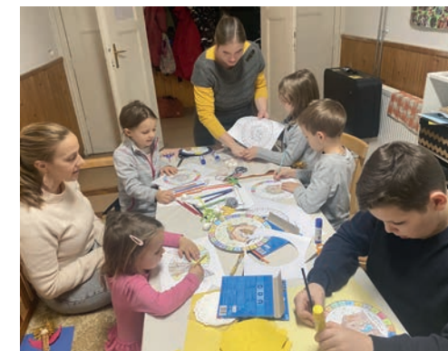
Ádventi kézműves délután