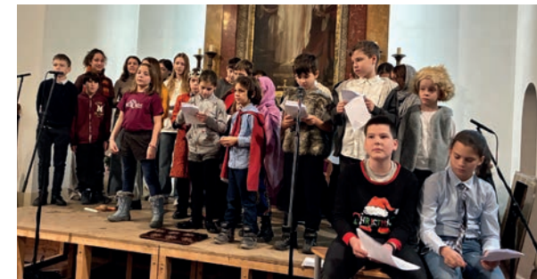
karácsonyi műsor a templomban